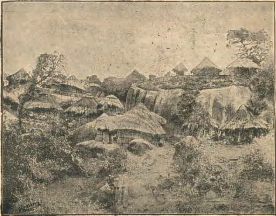
KAFFERKRAAL BO OP DI KOP BY SIMBABWE.