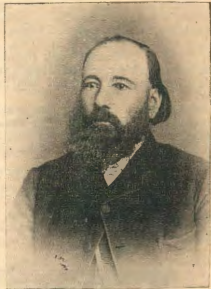
KOMMADANT P. A. CRONJE,

nuwe Hebreuse letters skrywe en dan opsoek in di woordeboek. Mar ek sal di leser nou ni fermoei met di gesukkel ni 'n Mens wat mar gewoon Hebreus geleer h t kan ni so makkelik di taal sonder di klanktekens lees ni, en dan nog in di oue letters. Fol-lende keer gé ek myn ontsyfering en fertaling daarfan.