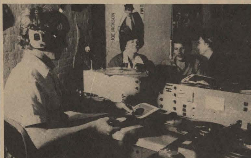
Die omroepers en operateurs van Radio Puk in aksie tydens 'n uitsending. Daar is nou poste vakant vir aspirant omroepers en operateurs. Keuring vir belangstellendes sal by die Radio Puk ateljee plaasvind op die volgende dae: Woensdag 7 Oktober en Donderdag 8 Oktober om 18h30 tot 19h30. Operateurs kan by die ateljee kom reëlings tref vir opleiding.

Op versoek van die Rektor het die SSR besluit om toe te sien dat soveel as moontlik studente-aksies gedurende naweke sal plaasvind en dat die weksdae dus vir die akademie oopgehou sal word, maar dat een naweke per maand vir huistoegaandoelendes oopgehou sal word. Dit sal sorg dat daar genoeg ontspanning oor naweke is, dat die akademie die nodige prioriteit geniet en dat studente tog genoeg tyd kry om huistoe te gaan. Die naweke wat in 1981 oopgehou moet word, is 7 en 8 Maart en 3 en 4 Oktober. In die ander maande is daar in elk geval langnaweke, vakansies en bloktye. Die SSR-lid vir publikasies moet vir uitsonderings op dié reëls genader word. (Hierdie is 'n besluit van die ou SSR). Teoreties is hierdie 'n baie goeie reëling, maar 'n mens wonder of dit altyd so prakties uitvoerbaar