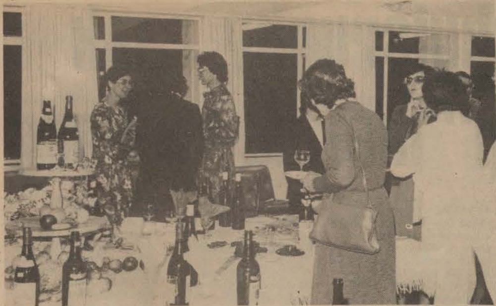
● Lede van die Suid-Afrikaanse Instituut vir Biblioteek- en Inligtingswese verkeer hier in 'n gesellige luim tydens 'n kaas-en-wynfunksie ná afloop van die algemene jaarvergadering.