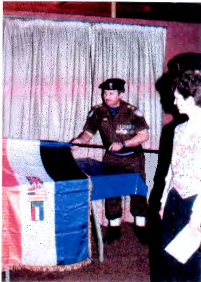
Illus. 108: Neerlegging van die vaandels. Die nasionale vaandel van die ROV word opgerol om weggeleë te word nadat daar in Maart 1997 besluit is om dié eenheid te ontbind.