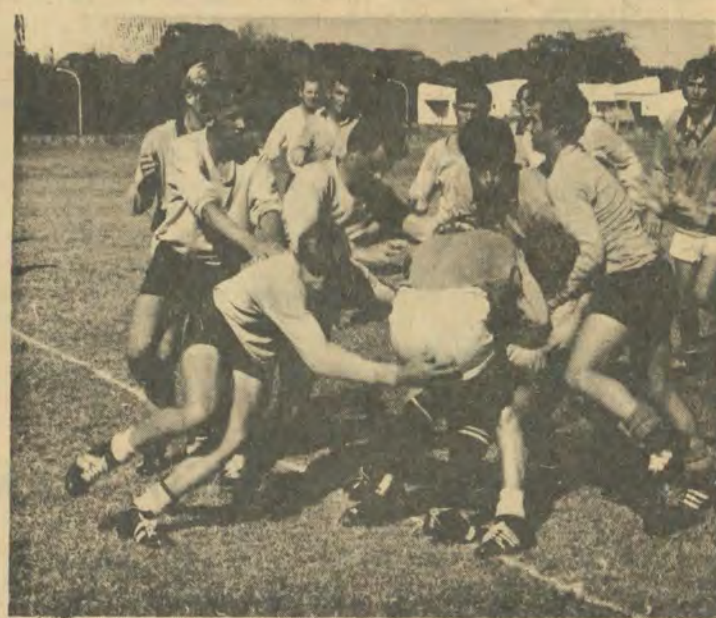
Liberalia en Westelikes spook woes om besit van die bal in hulle wedstryd verlede Saterdag.

'n Gebrek wat allerweë gevoel word is die afwesigheid van 'n interkoshuisliga. Feitlik elke koshuis het die nodige geriewe, en die instelling van so 'n liga behoort die belangstelling verder aan te wakker.