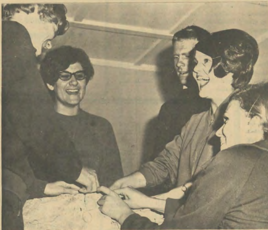
Dit was seker 'n goeie een!