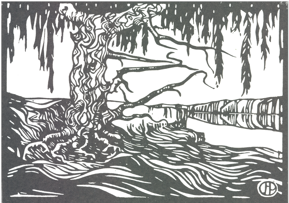
Figuur 86: J.H. Pierneef, Wilgerboom en stroom 367

Die “Wilgerbome langs die Vaalrivier” figureer ook prominent in sy olieverskilderye wat die seisoene, in hierdie geval herfs, langs die Vaalrivier vasvang (Figuur 84) [olie op paneel: 35,5 cm x 51 cm, geteken: Pierneef r.o., 1923] & (Figuur 85) [olie op paneel: 34,5 cm x 50 cm, geteken: J.H. Pierneef l.o., 1923]. In sommige van sy lino- en linosneë (Figuur 87) [linosnee: 36,7 x 28,7 cm, geteken: P in sirkel l.o., 1920], (Figuur 88) [linosnee: 36,7 x 28,7 cm, geteken: P in sirkel l.o., 1920] & (Figuur 86) [linosnee: 21.3 x 26.5 cm, geteken: JHP monogram in sirkel r.o., s.a.] is die treurwilg ( Salix babylonica ) uitgebeeld. Verder het Pierneef die wildesering ( Burkea africana ), ook bekend as waboom, in sy skilderye, lino- en houtsneewerke gebruik. 366 Hierdie bome, wat as ’n simbool van die ou “Transvaalse Bosveld” gesien word, kom algemeen in die bergagtige bosveldbloom in die Koepel-omgewing voor.