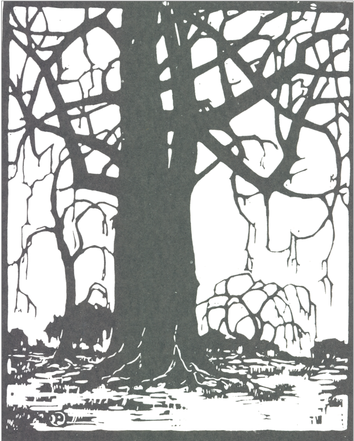
Figuur 87: J.H. Pierneef, Wilgerboom in die winter 368