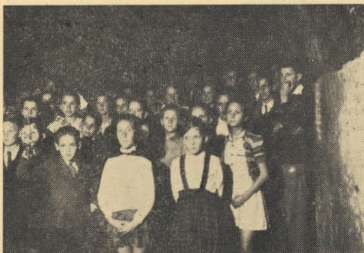
IN DIE MARTELKAMER: Die Boerejeug van Kaapstad het onlangs 'n besoek aan die ou Kasteel in Kaapstad gebring. Onder meer het hulle ook die martelkamer waarin Adam Tas was, besoek, waar hulle afgeneem is. Die kelder is vier voet onder die seespieël en is pikdonker. Die seuntjie links hou die sleutel van die Kasteel in die lug.