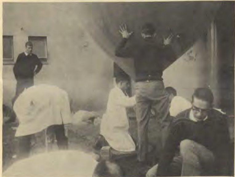
Lede van die Departement Fisika besig om 'n ballon in gereedheid te kry vir die lansering verlede Vrydag.