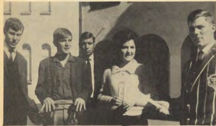
Die groepie was van die laastes wat die veelbesproke toetsweek aangepak het.

Die feit dat die eksamen nou ook 'n hoofstuk in gister en eergister se verhale is, al moet die naskrif nog volg, is darem 'n troos. Vir die wat nou nie juis op 'n soort van segetog was nie, is daar darem nog kans om te skrik en te wik en met meer ywer aan die akademies te pik, want daar sal maar altyd weer referate en toetse op die horison verskyn waarmee die studente rekening moet hou wat een of ander tyd hiervandaan wil verdwyn.