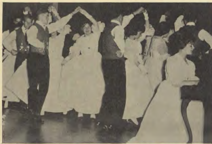
Gaan die volkspelers weer so maak? Die groep op die foto het tydens verlede jaar se A.S.B.-Kunsfees met die louere wegge-loop en is hier besig met 'n vertoning in die Totiussaai.

'n Aantal van sy beste werke is: Caesar ('n versdrama waarmee hy die Eugène Marais-prys verower het; in 1961, Lobola vir die Lewe (1962), Potpourri (1962), Sempre Diritto (1963), Die Ambassadeur (1963, wat hy self in 1964 in Engels vertaal), en Orgie (1965).