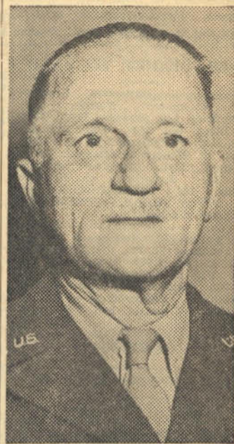
Genl. C. A. Spaatz.

Gemeen word dat die projektiel reeds die proefnemingstadium verby is.