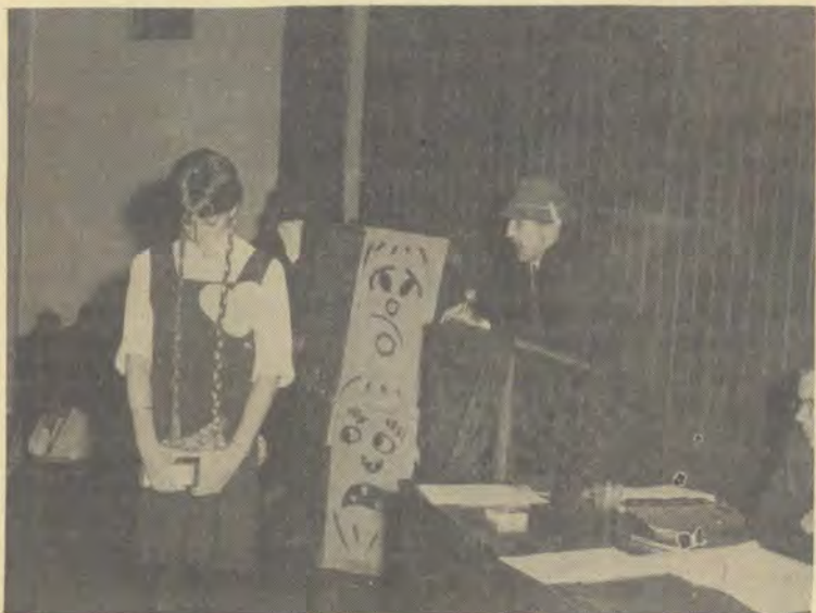
Gaan die Pukke weer volgende jaar so 'n toneel uit die Hof van Hades sien? Dit is een van die baie vrae wat vandag op die kampus oor die moontlike afskaffing van Inlywing gevra word.