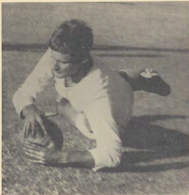
BETYDS GEKEER !!!

A. Hawthorn, doelwagter van die Puk, in aksie.