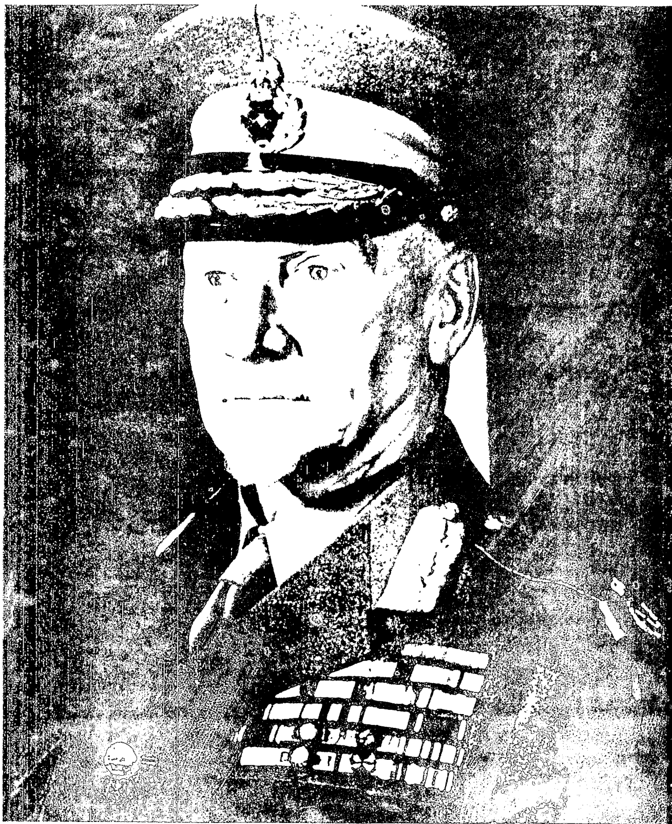
PLAAT 2.3 GENERAAL J C SMUTS, MINISTER VAN ONDERWYS VANAF 1907 EN LATER EERSTE MINISTER VAN DIE UNIE VAN SUID-AFRIKA 115)