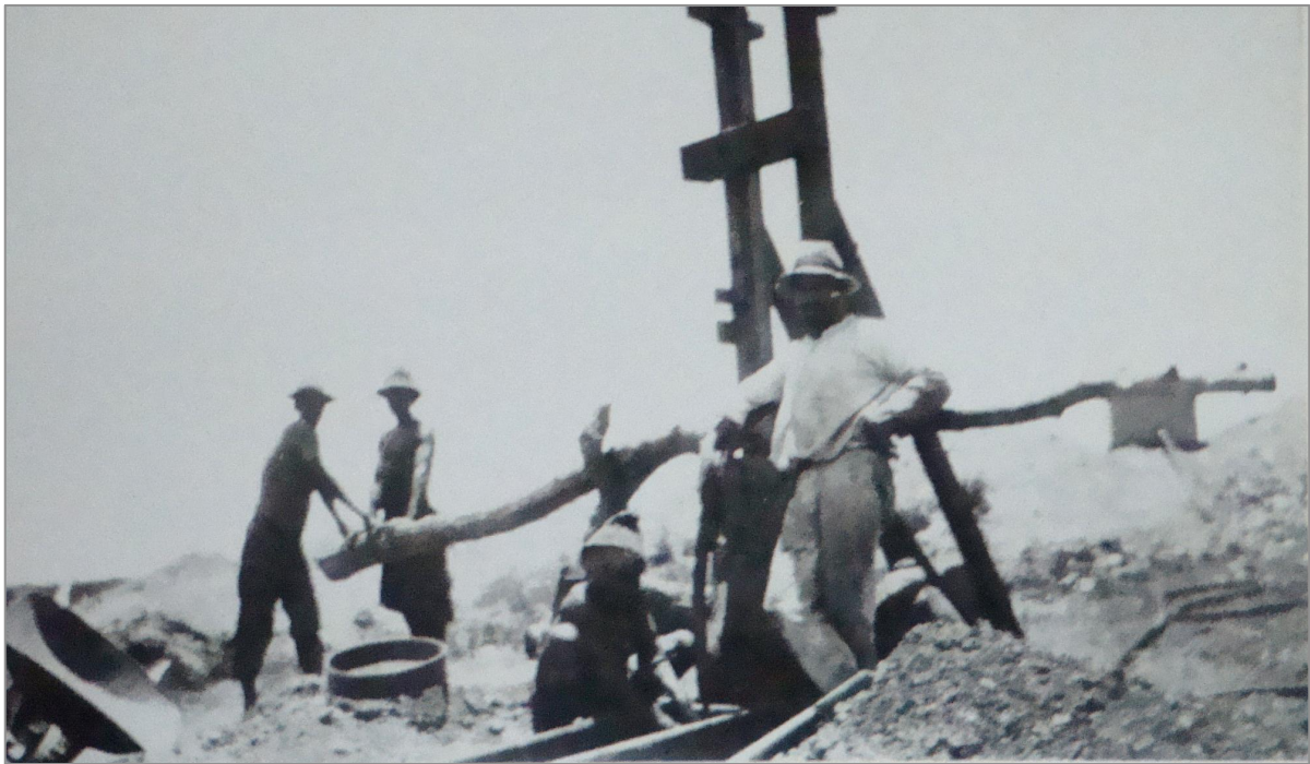
Figuur 20: Delwery met die wipplank-metode 446

in die Klerksdorp-omgewing, probeer om sonder water, met die sogenaamde "dry crushing"-metode, die goud-prosessering te verrig. 444 Dit was egter 'n groot mislukking. In 1914 is toestemming verleen om water uit die Vaalrivier te pomp vir delwery-doeleindes, 445 terwyl daar vir 'n waterlisensie gewag was. Ons kan hieruit aanneem dat dit in daardie tyd betreklik lank geneem het om 'n waterlisensie vir delwerydoeleindes te bekom. Die water is hoofsaaklik in die mynbedryf benodig om stof te bestry asook vir was- en vervoerdoeleindes, en vir verkoeling in smeltery. Die aspekte van menslike kultuur wat hier te doen het met die ontginning en benutting van materiële hulpbronne, ressorteer onder die ekonomiese lewe van 'n gemeenskap. Dit is ook duidelik dat produksie, distribusie, omset en verbruik ('n ekonomiese stelsel) as onderdeel van 'n kultuur sedert die Laat-Ystertydperk in hierdie studie-area aangetref is.