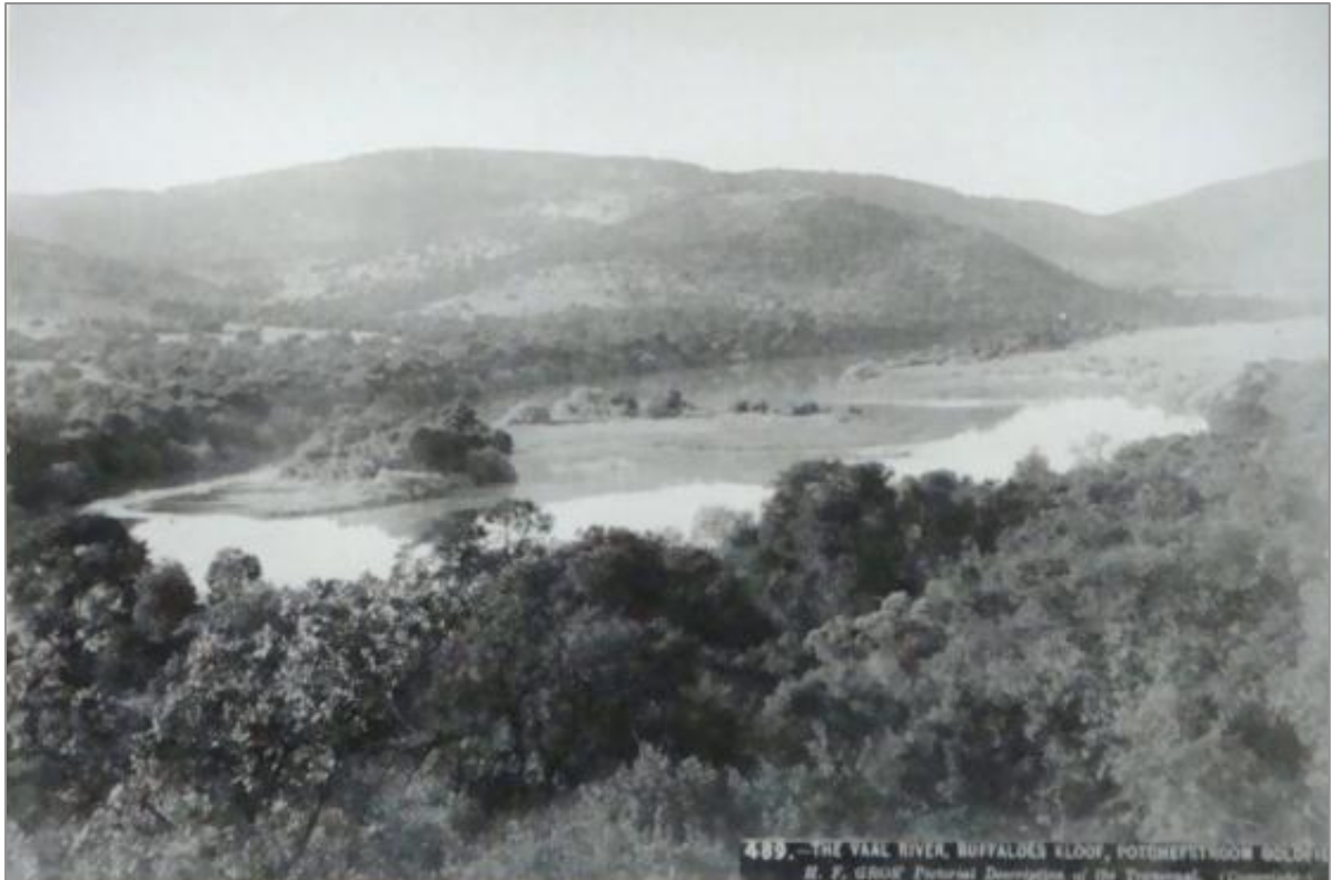
Figuur 22: Vaalrivier by Buffelskloof op die Potchefstroomse Goudvelde 473

President Reitz het in 1890 die swak vooruitgang in die goudontginning toegeskryf aan die feit dat die bestaande wette nie aan die regering magte verleen het, soos in ander lande die geval is, om "zonder verlof van den eigaar eene plaats open te stellen als publieke goudwery" nie. 474 Gevolglik wou hy 'n konsepwet indien vir "onteigening ten algemeenen nutte met of zonder vergoeding". 475 Teen 1892 het die Vrystaat se onwettige diamanthandel in só 'n mate onmin veroorsaak, dat president Reitz verplig was om 'n permanente kommissie te benoem om alle reëlins in verband met wette en proklamasies oor diamantdelwerye te behartig. 476 Vervolgens is daar in 1895 'n wetsontwerp opgestel vir die onteiening van "plaatsen waar edelgesteentes gegraveer worden