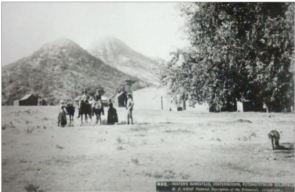
Figuur 21: Venter-opstal, Venterskroon, op die Potchefstroomse Goudvelde (ca. 1902) 472

Nooitgedacht 89 (Colin Voi Mine), 468 Welgevonden 1054 (Welgevonden Mine) 469 en Lindequesfontein 73 (Mayer's Mine), 470 asook spore van private mynbou-aktiwiteite op Eensgevonden 232, Rebokrand 200, Willie 905, Weltevreden, Kopjesdam 434, Witbank 166 en Helena 780. 471