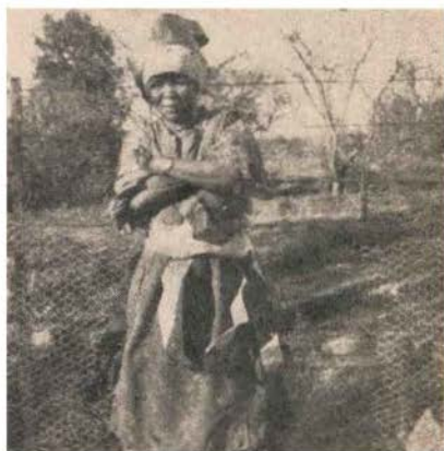
Ou Els, 'n tipiese Grikwa-Koranna- meid in die distrik Petrusburg.