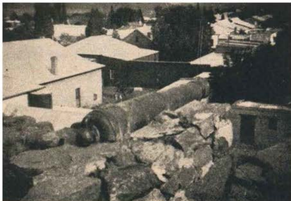
Grikwa-kanon op Philippolis.