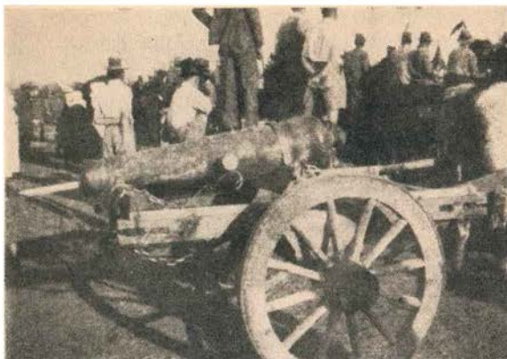
Grikwa-kanon op Philippolis.