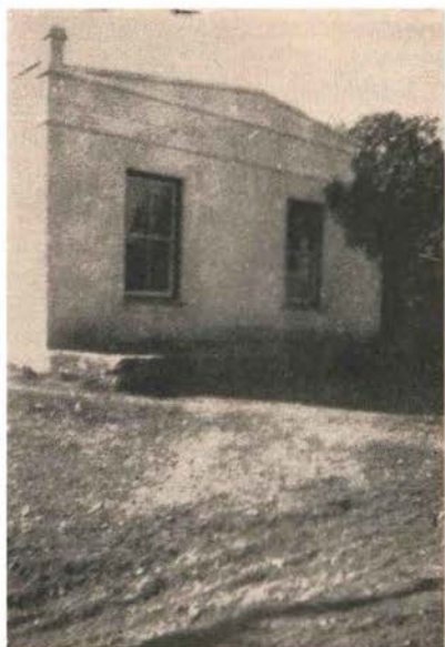
Eerste huis wat op Jacobsdal gebou is.