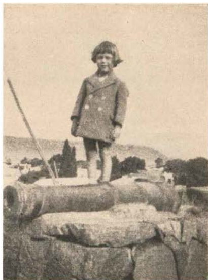
Grikwa-kanon op Philippolis.