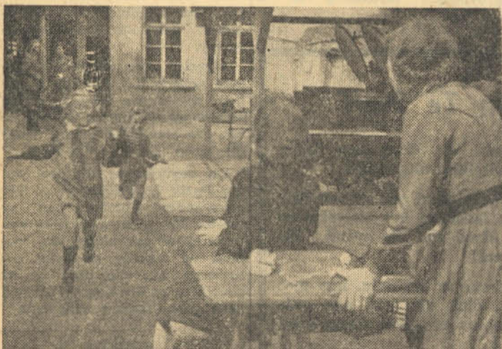
Moedertjie, kom kyk! Nuwe skoene uit Suid-Afrika.

Gelukkige mens wat verantwoordelik is vir hierdie vreugde. Dit kan u deel wees. Bring vreugde in die hart van ’n kind en geluk in u eie lewe deur ’n bydrae vir die nood in Duitsland. Moenie uitstel nie. Stuur u bydrae aan: