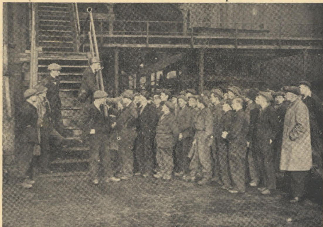
Britse steenkoolwerkers by 'n myn. Hulle weier om meer as vyf dae per week te werk onderwyl hul land in die grootste krisis van sy geskiedenis verkeer weens gebrek aan steenkool.

Origens word oorweeg om mense van een werkkring na 'n ander te verplaas, waar hulle meer nodig is. Aangesien die steenkoolmyne op die oomblik die middelpunt van die krisis is, sal dit beteken dat Britte in een of ander vrye beroep wat as minder belangrik beskou word, deur die staat gedwing kan word om in die steenkoolmyne te gaan werk—'n maatreël wat sy gelyke net in Rusland het.