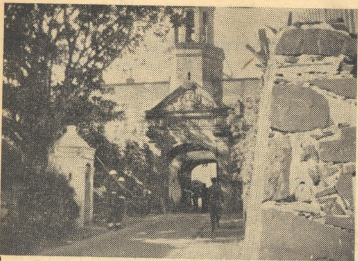
Bo: Die huidige ingang tot die Kasteel.