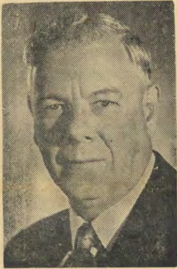
Dr. H. F. Verwoerd.