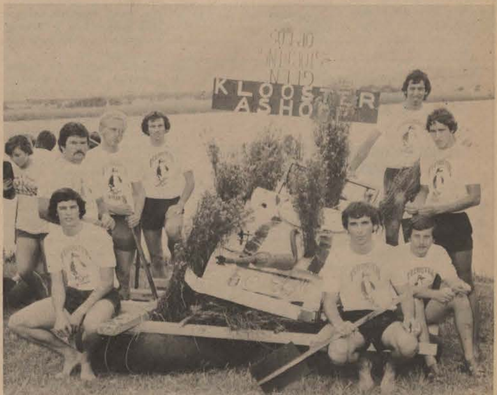
Wenners van die Kaap na Rio.