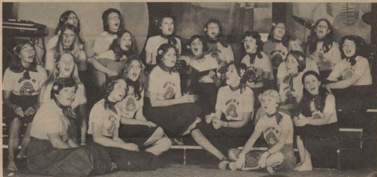
Vergeet-my-nie, die weners van die dames sêr.

As ons eers begin bedank hou ons nooit op nie, maar die mense wat die grootste dankie verdien, is die H.K. en die manne van Overs. Die ruiker was pragtig. Die Vleimanne se liefde vir hulle trapkar het vir 'n geurige fleurige voorportaal gesorg. Om karnaval finaal af te