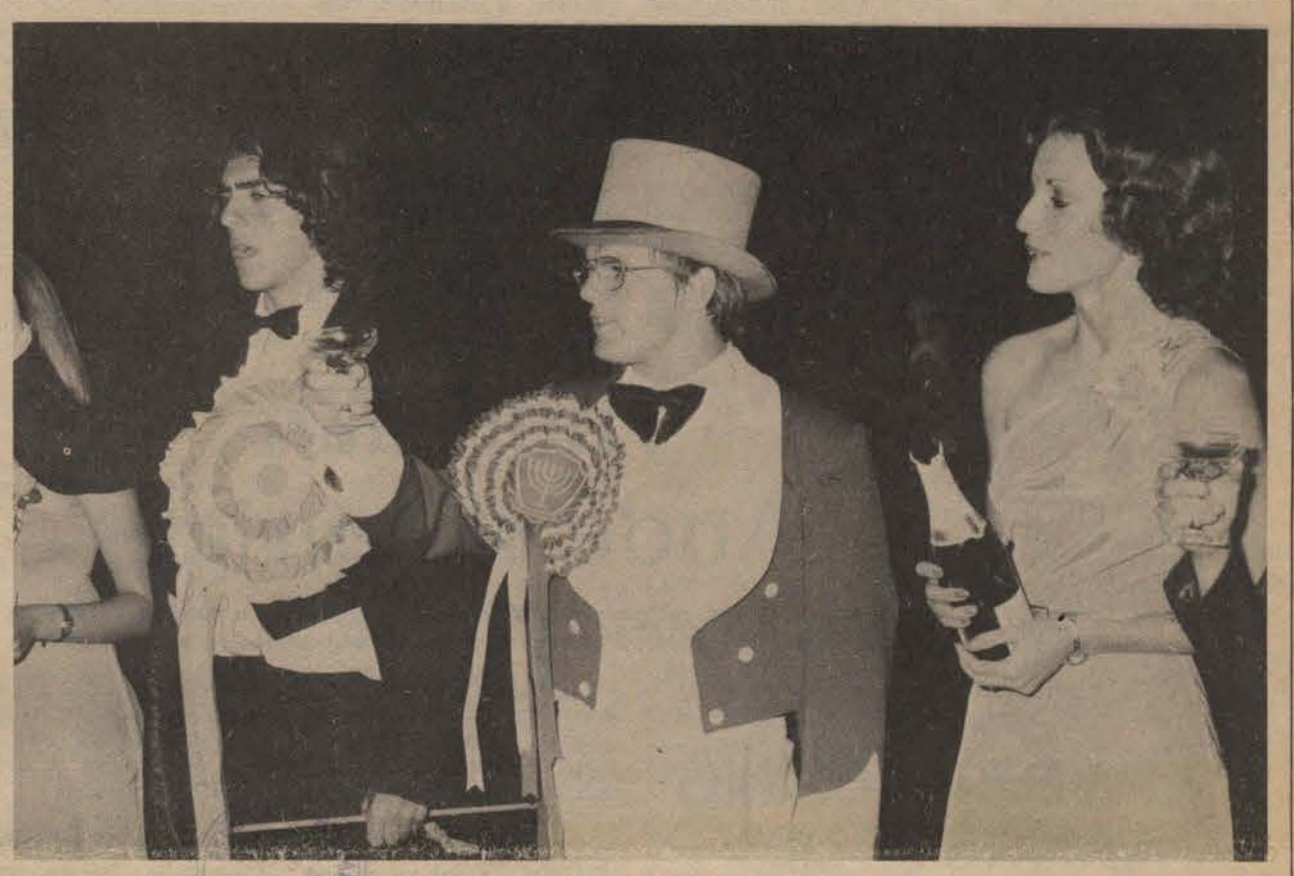
Die glasies word geklink voor die hoofwedstryd. (Nog foto's op p 6 & 7).