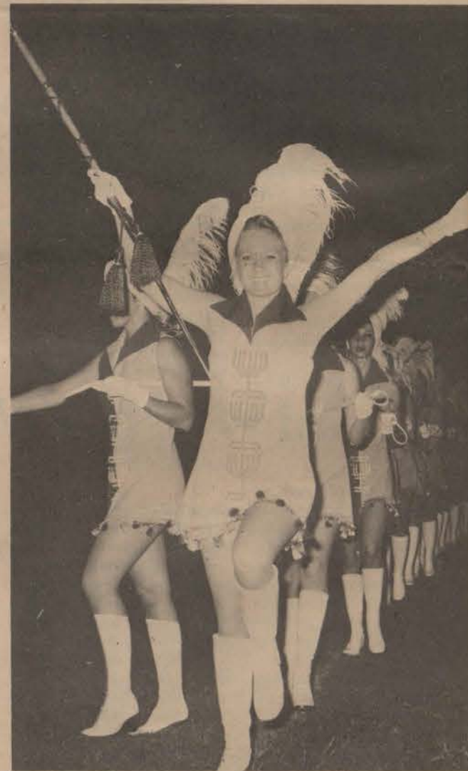
Puk se trompoppies het alreeds die Pukke in die regte stemming ge- vir die groot oorwinning.