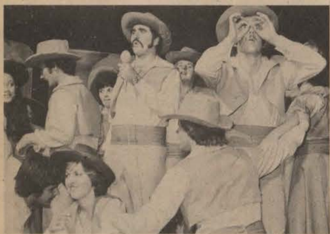
Reg geraai! Alabama se 1978 Revue.

Dit skyn asof Alabama op sy ou sukses teer. 'n Verandering (nie noodwendig die styl nie) kan 'n tweeledige effek hê. Die publiek kan voel dat dit nie meer Alabama is nie, maar dit kan egter ook positief en verfrissend wees. - G.S.