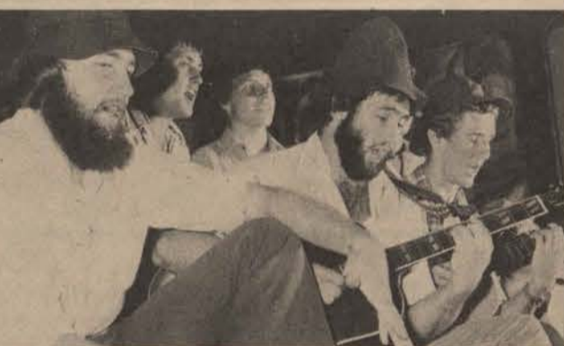
Dis nis baie moeilik om te raai hoekom Overs die mansêr gewen het nie.