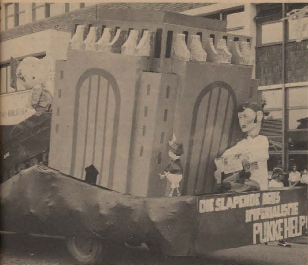
Wie of wat moet gehelp word.