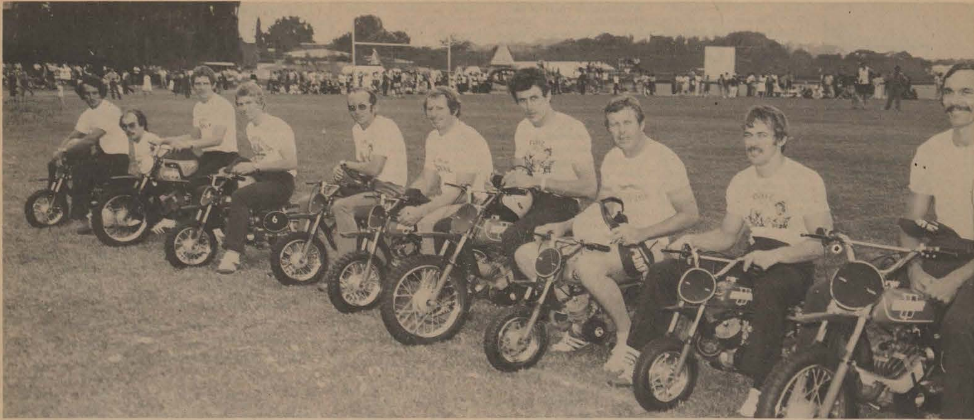
• Groot sportmanne op klein motorfietse