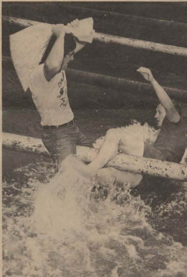
Een moet af!