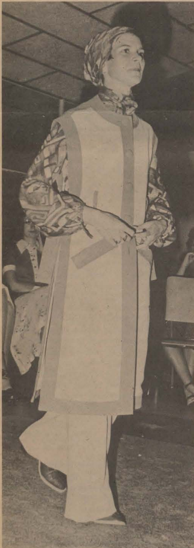
Een van die modelle tydens die modeparade.