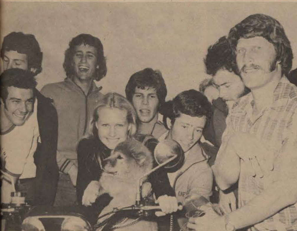
Hier gaan dit meer as net om die hondjie.