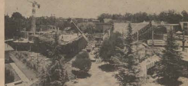
Die studentesentrum hier in 'n vroeë stadium sal teen die einde van die jaar die kern van die studentelewe vorm.

Vir die oorspronklike plan is daar aan die argitekte opgedra om 'n studentesaal te ontwerp, aangesien die stadsraad van Potchefstroom self planne gehad het om 'n stadskouburg te bou. Dit het meegebring dat daar net een syverhoog is en geen verhoogtoering nie. Hierdie afskeepwerk sou vergewe kon word as daar nie - aan die ander kant - 'n standaardorkesput wat heeltemal toegevoeg is in dieselfde ouditorium ingebou was nie, en dit in 'n saal wat nie akoesties vir operamusiek ontwerp is nie! Een van die argitektheit het in 'n telefoniese onderhoud gesê dat hierdie gehoorsaam nie goed vir simfonie sal wees nie. Die orkesput was ook nie oorspronklik deel van die plan-