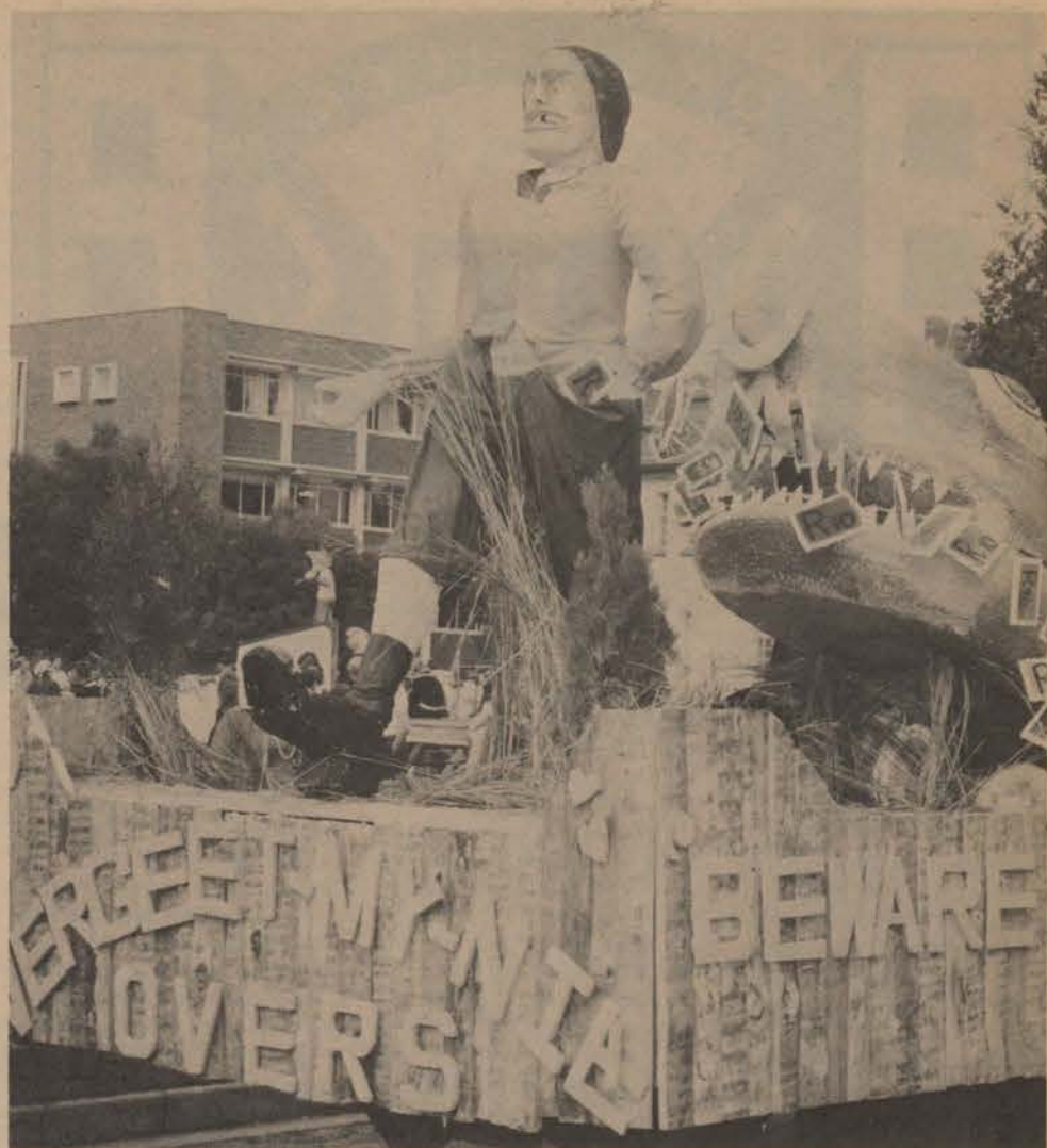
Sal ons dit ooit vergeet.