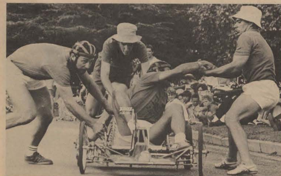
Kyk net hoe help die manne mekaar. Elke sekonde is kosbaar sodat daar soveel rondes as moontlik afgelê kan word.

Nadat deelnemers van ander universiteite buite rekening gelaat is, het Amajuba die wedren gewen. Over de Voor was tweede en Klooster derde.