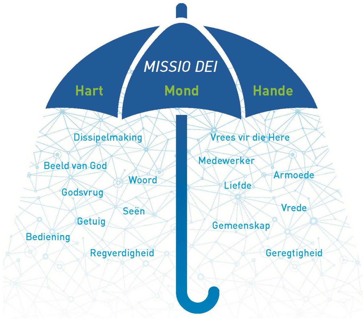
Figuur 2-1: Sambreel