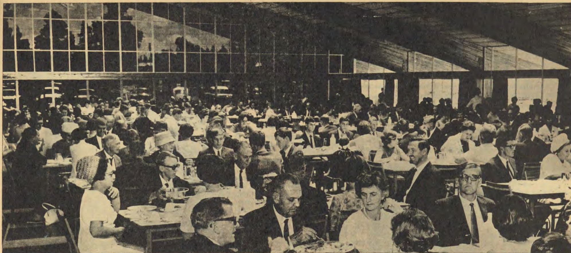
So het dit verlede Dinsdag in die nuwe eetsaal gelyk toe die eerstejaars en hulle ouers middagete daar geniet het. Alles moontlik is vanjaar gedoen om die dag vir die ouers aangenaam te maak.