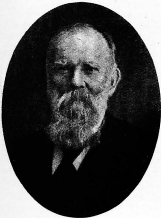
Pres. F. W. Reitz.