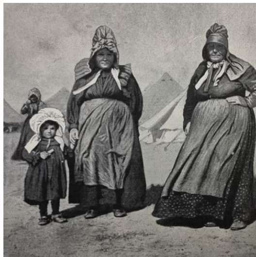
Figuur 5.4 – Illustrasie van Boerevroue in konsentrasiekampe.

In die tydperk toe die sterftesyfers in die konsentrasiekampe hoog was, het pro-Britse propaganda hoogty gevier. Die hoë dodetal in die kampe is deur pro-Britse pers beskryf as die gevolg van die Boerevrou se agterlikheid en hardkoppigheid, en dat die behandeling van die vroue en kinders in die kampe hoegenaamd nie onmenslik is nie. Die Britse koerant, The Graphic , het die volgende berig en illustrasie van twee Boerevroue en 'n klein dogtertjie op 10 Mei 1902 gepubliseer: