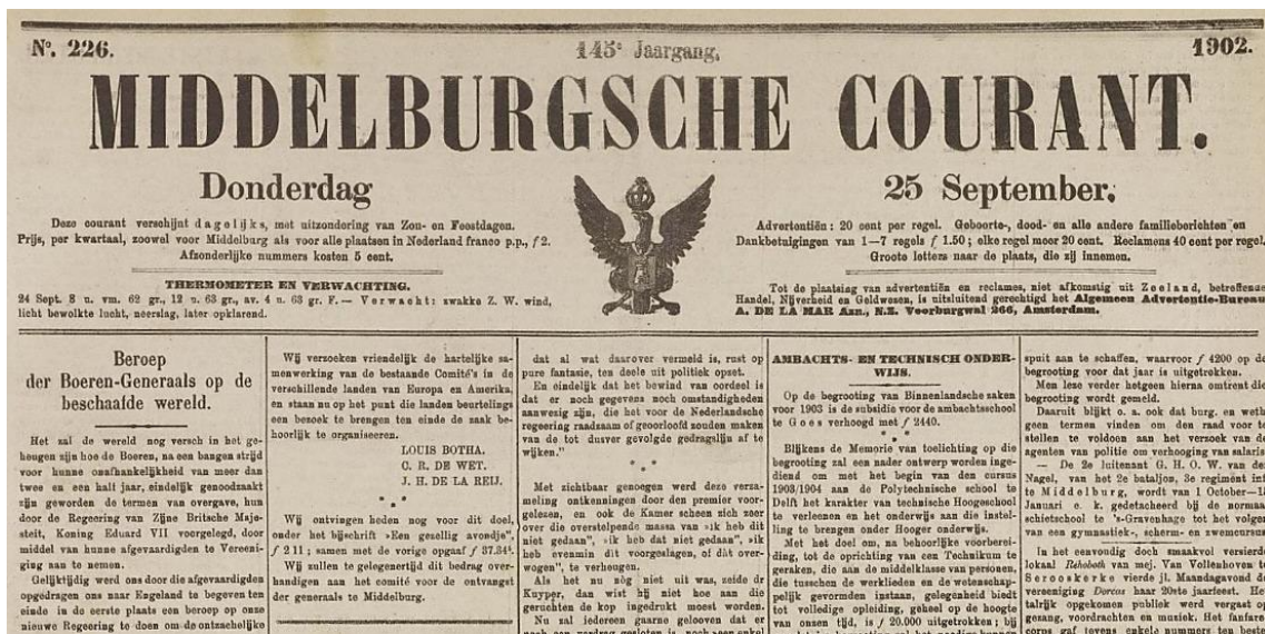
Figuur 5.3 – Uittreksel uit die hoofartikel in Middelburgsche Courant van die Boeregeneraals se brief.

Verskillende ekonomiese benaderings is gevolg met betrekking tot befondsing na die oorlog. Gegewe die armoede van die Afrikaner het Boeregeneraals Botha, De Wet en De la Rey op 25 September 1902 in verskeie Hollandse koerante ’n aanhangsel gepubliseer waar die generaals vir die ‘beskaafde’ wêreld vra vir befondsing om die opheffing van die Afrikaner (Boere) aan te help. 33 Sien die volgende uittreksel: