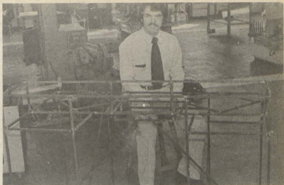
DIE RAAMWERK VAN RADIO PUK SE NUWE KONTROLEBORD. Na 'n lang stilte sal hulle klanke binnekort weer gehoor word.

Studente kan afsprake persoonlik of telefonies maak by die sekretaresse. Die telefoonnommer is 7497 of 22112 (uitbreiding 287 of 284).