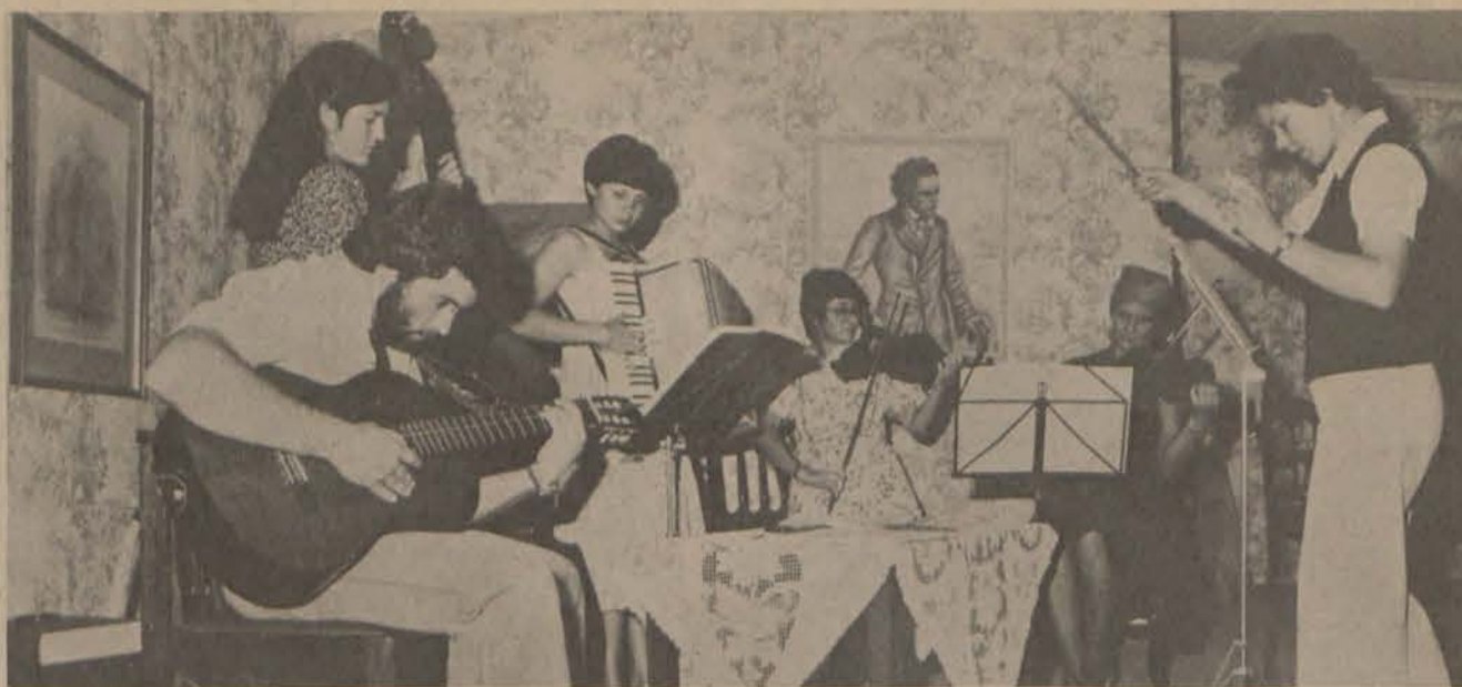
Die Potchefstroomse "Wiener Schrammel Ensemble" is die musikante wat mens met musiek wegvoer na "Wenen, stad van my drome".