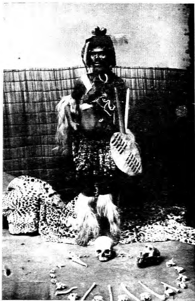
'N DOLUS GOOIER.