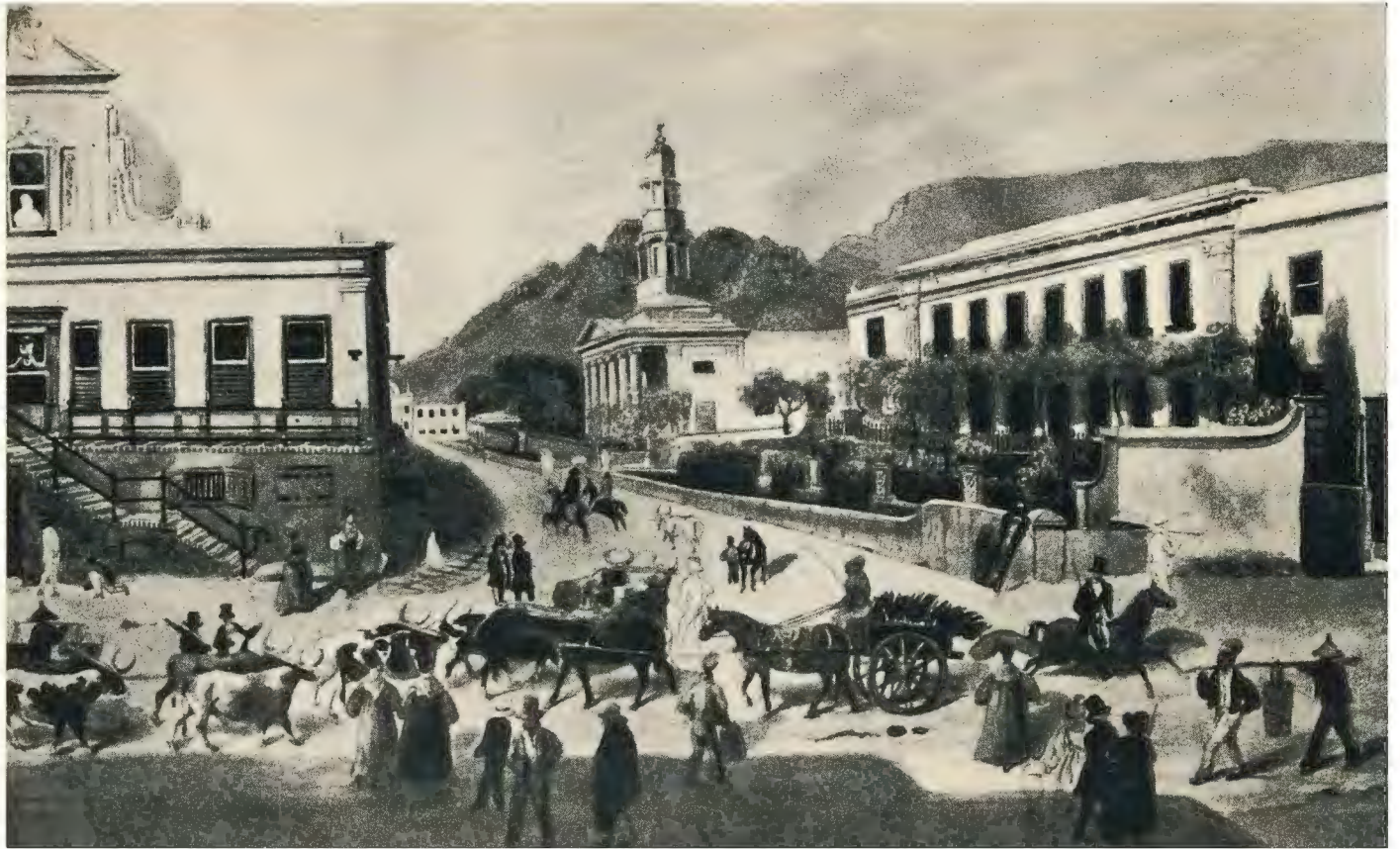
Plaat 6 —GESIG OP WAAL- EN BURGSTRAAT, TOEGESKRYF AAN J. WALKER, 1832.—Sien bls. 82.