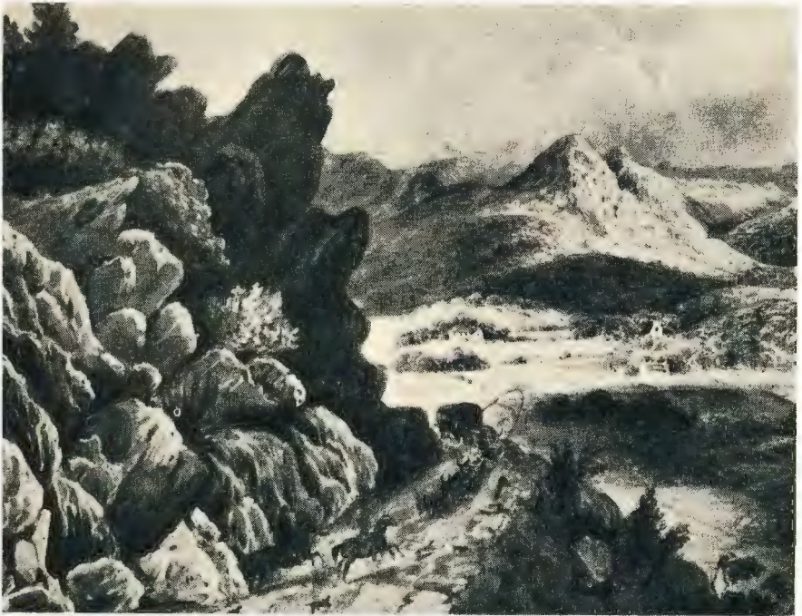
Plaat 5.—DIE FRANSCHHOEKSE PAS, KOMENDE VAN FRANSCHHOEK, TOEGESKRYF AAN J. WALKER, 1832.—Sien bls. 165.