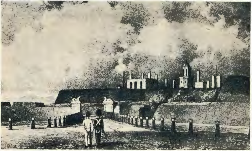
Plaat 8. —DIE KASTEEL, KAAPSTAD, 1832.—Sien bls. 179. (Na 'n gravure van H. C. de Meillon in Alm. , 1834.)