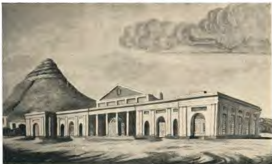
Plaat 14. —DIE BEURS, PARADEPLEIN, KAAPSTAD, ± 1825.—Sien bls. 189. (Deur J. F. Comfield. Uit Hiddingh-Tekenboek.)