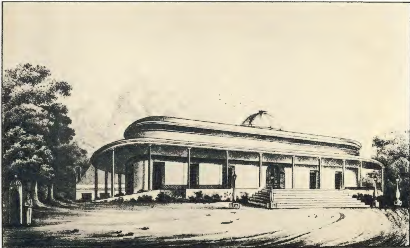
Plaat 3. —NIEUWLAND BUITENVERBLIJF VAN DEN GOVERNEUR GENERAAL, 1 ACHTER DEN WINDBERG AAN DE KAAP DE GOEDE HOOP. 2