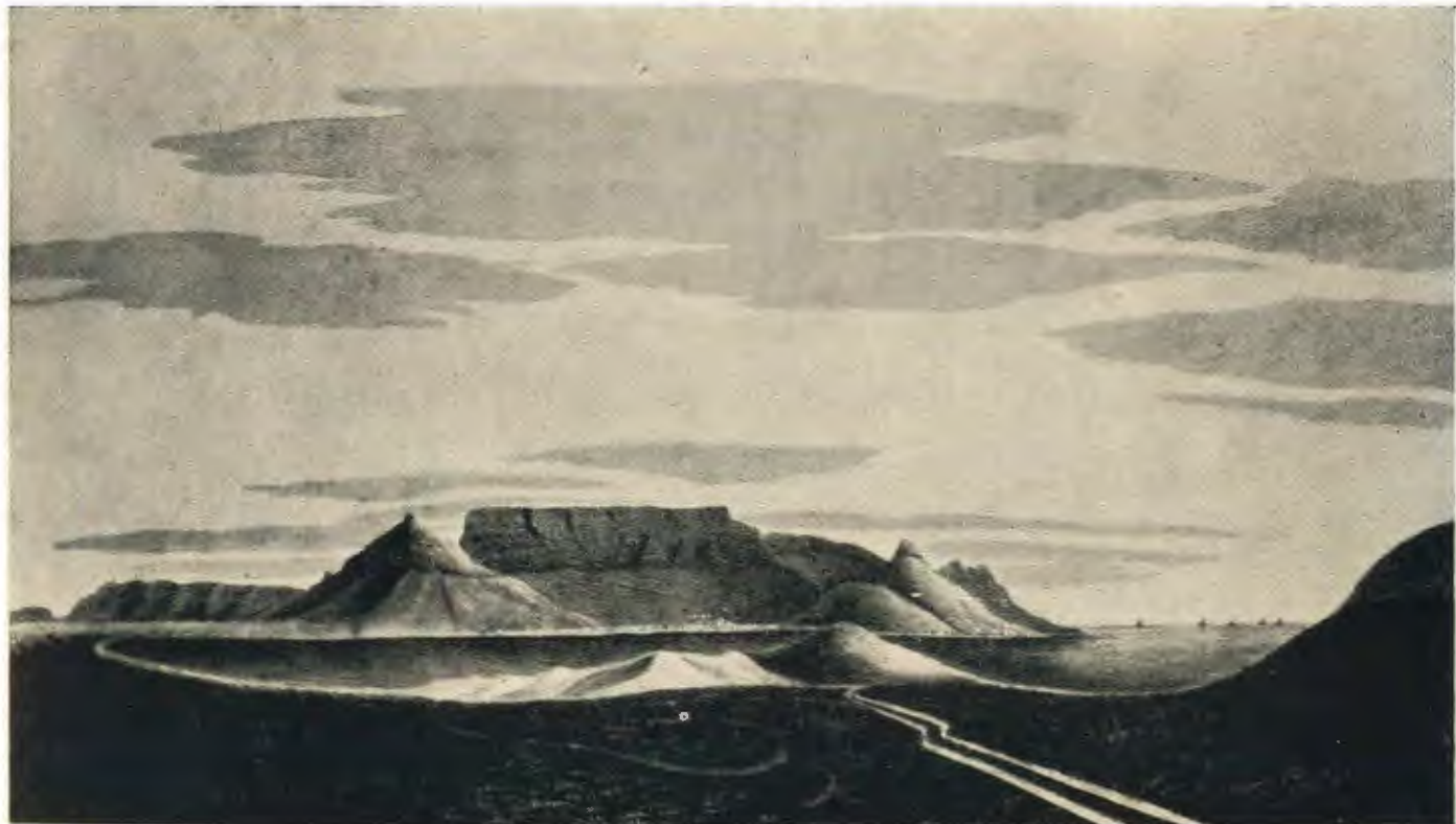
Plaat 1.—GESIG OP KAAPSTAD VAN BLAAUWBERG, ±1824. (Deur J. F. Comfield. Uit Hiddingh-Tekenboek.)