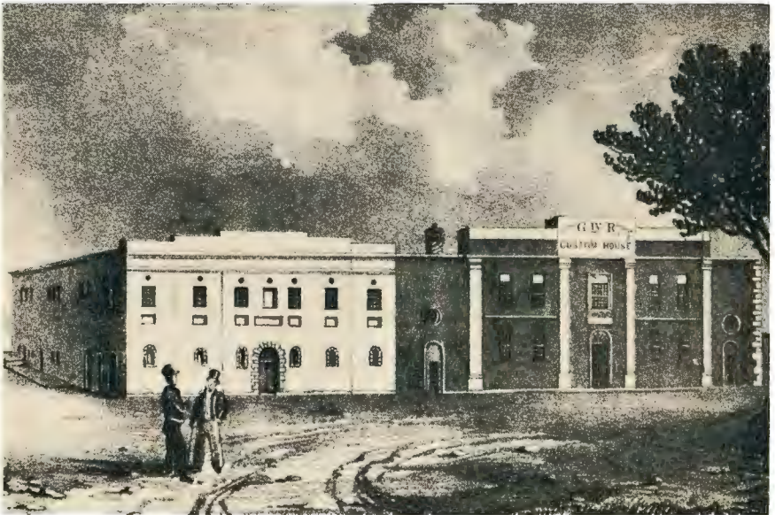
Plaat 12. —DIE TRONK EN DOEANEKANTOOR, STRANDSTRAAT, KAAPSTAD, 1832. (Na 'n gravure van H. C. de Meillon in Alm. , 1834.) —Sien bls. 188.