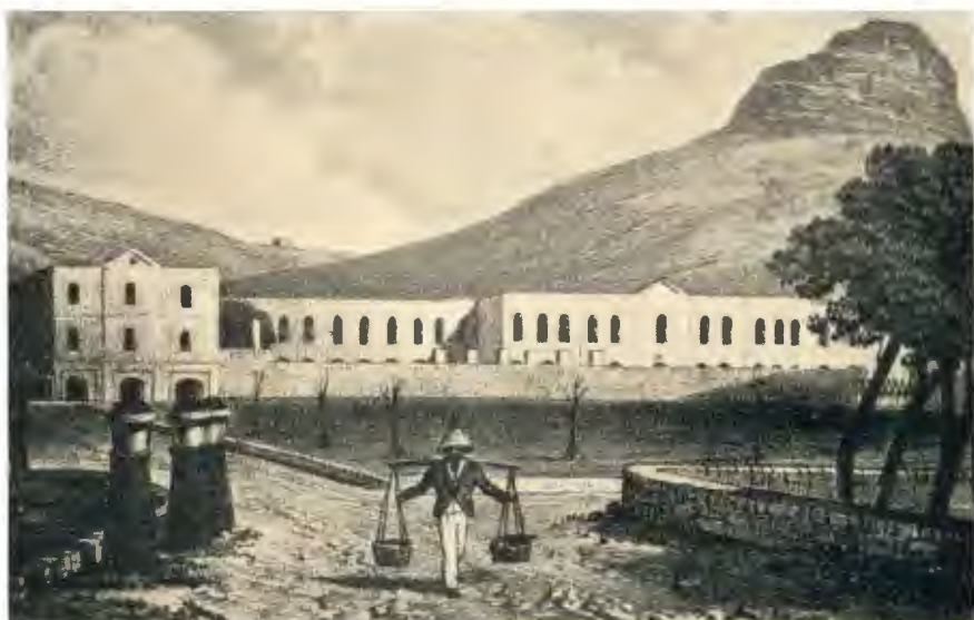
Plaat 13. —DIE HOOFKASERNE („MAIN BARRACKS”), KAAPSTAD, 1832.—Sien bls. 188 (Na 'n gravure van H. C. de Meillon in Alm. , 1835.)