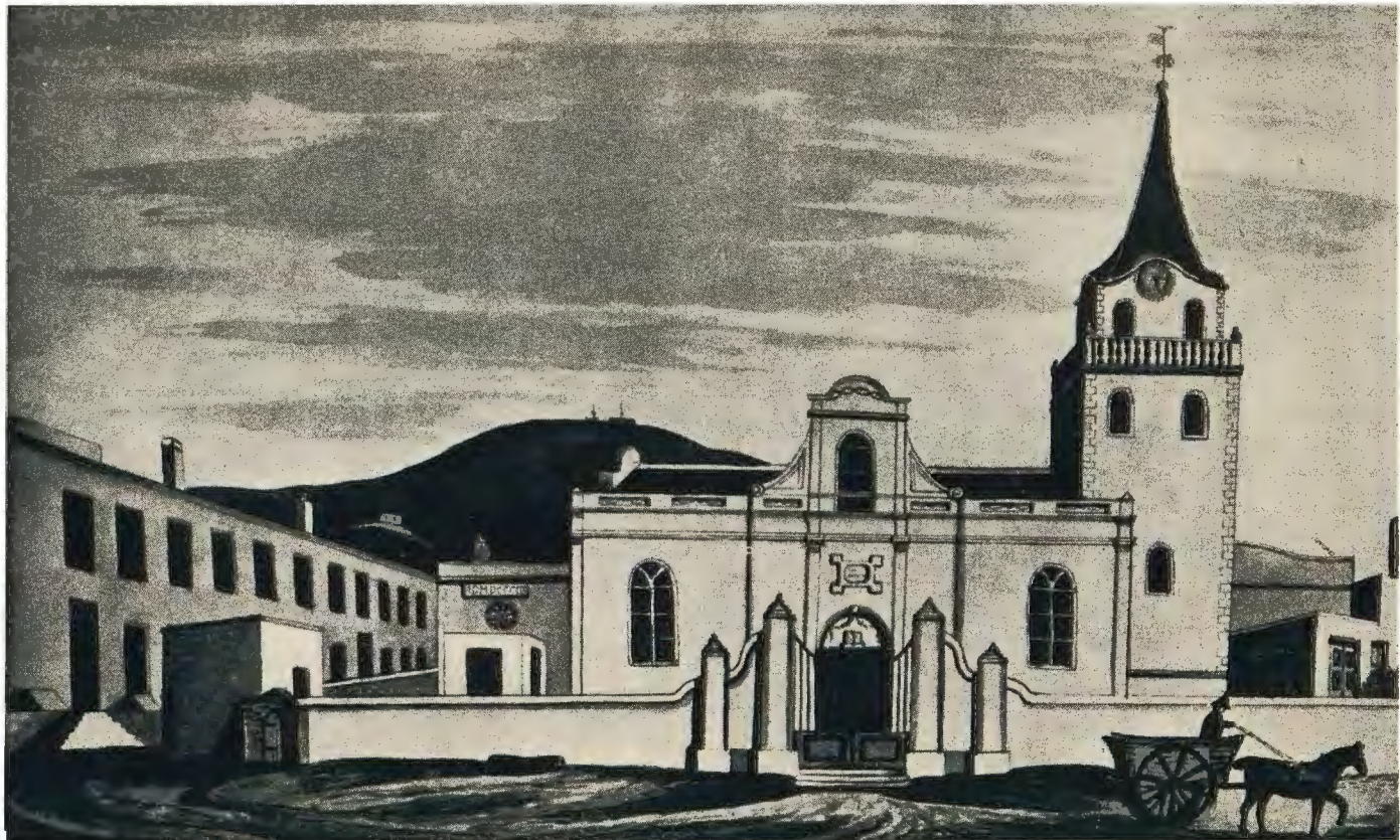
Plaat 10. —DIE NED. GEREFORMEERDE KERK, KERKPLEIN, KAAPSTAD, 1824.—Sien bls. 181. (Deur J. F. Comfield. Uit Hiddingh-Tekenboek.)