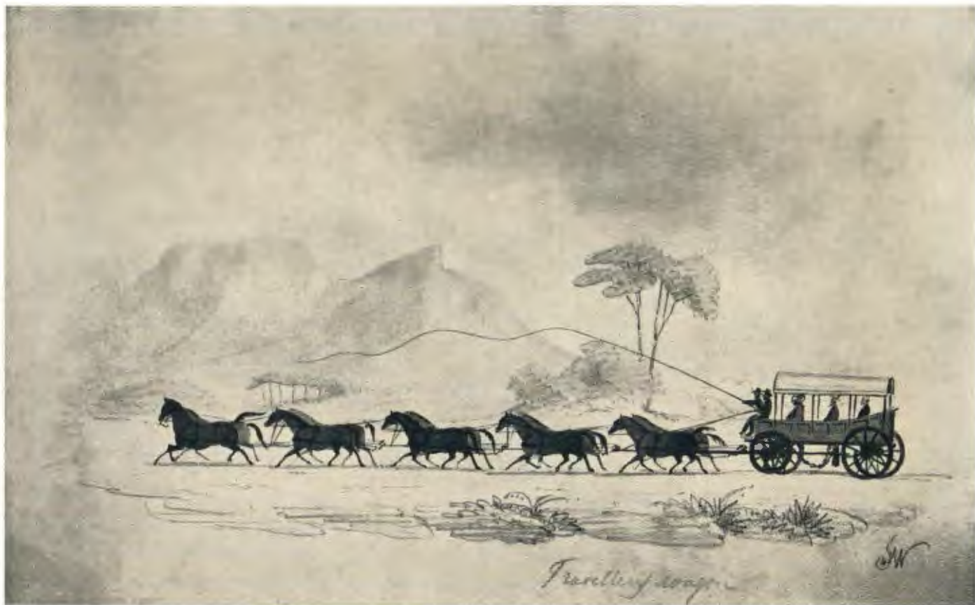
Travelling stage Plaat 7.—WA EN PERDE UIT ALBUM, TOEGESKRYF AAN J. WALKER, 1832.—Sien bls. 88.