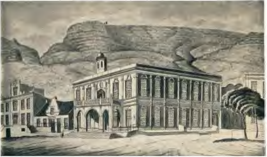
Plaat 11. —DIE OU STADHUIS (tans Michaelis-Museum ), GROENTEMARKPLEIN, KAAPSTAD, ± 1825.—Sien bls. 186. (Deur J. F. Comfield. Uit Hiddingh-Tekenbock.)