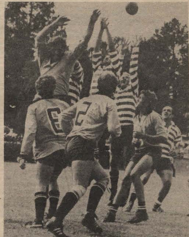
● Villagers en Amajuba spring hier hoog in die lynstaan om besit van die bal. Villagers wen die wedstryd 27-5.

Kan die swak vertonings van sekere sportsoorte tydens Intervarsities, 'n direkte gevolg wees van die swak dissipline in die sportklubs?