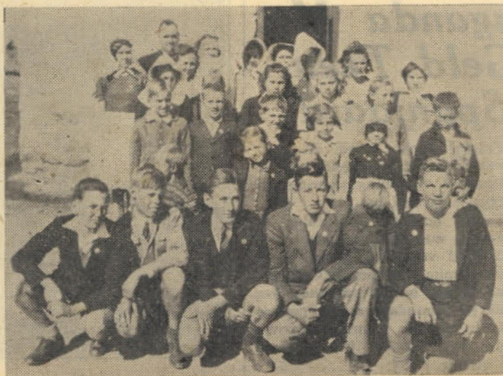
Oogies se veldkornetskap by geleentheid van 'n byeenkoms. Die Boerejeug van Oogies tel reeds meer as tagtig lede.