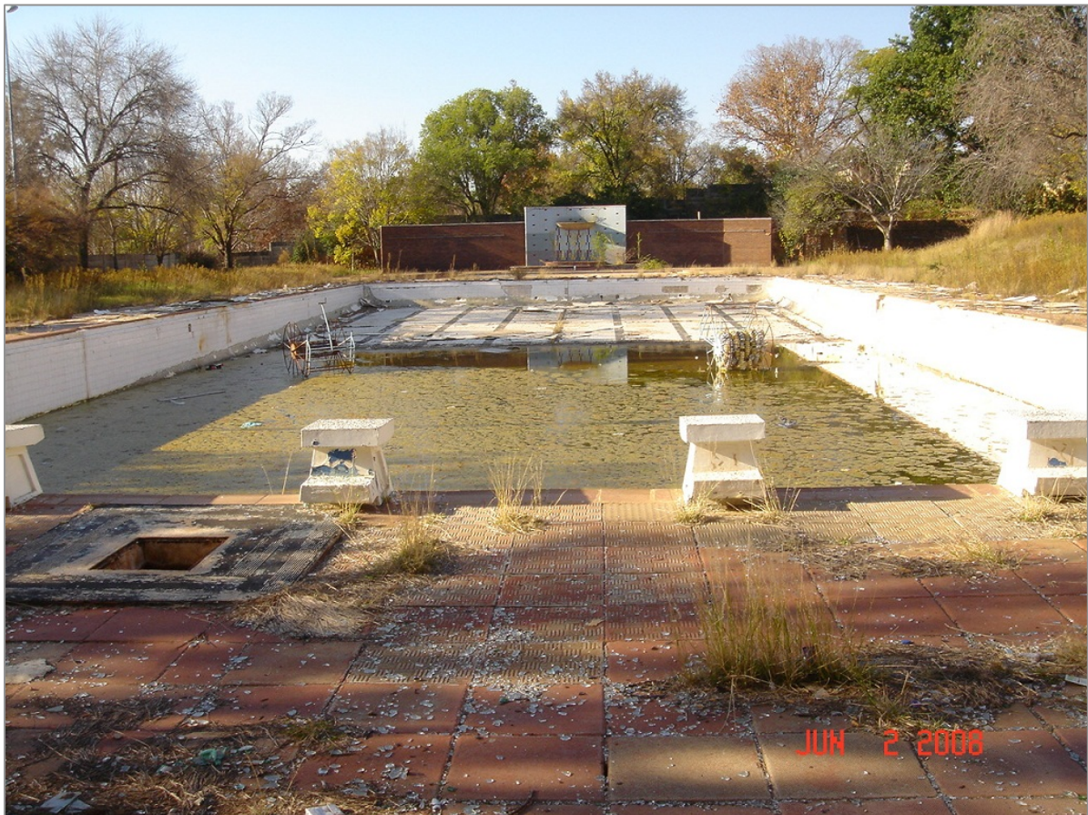
Figuur 81: Die swembad by Mimosa-tuine (2008) 334

hul eie braaiplek en swem-geriewe ingerig het. 333 Dit is sigbaar in die bogenoemde stoot- en trekfaktore (die toestand van Mimosa-tuine-oord en die skuif van die ander toerisme-aktiwiteite stroomaf), dat daar 'n geskiedenis van plaaslike toerisme bestaan. Die verandering van die toerisme-kultuur in 'n bepaalde omgewing, skep 'n breë geheelbeeld van die verloop van geskiedenis wat in 'n streek – in hierdie geval dié van Parys – kan plaasvind.