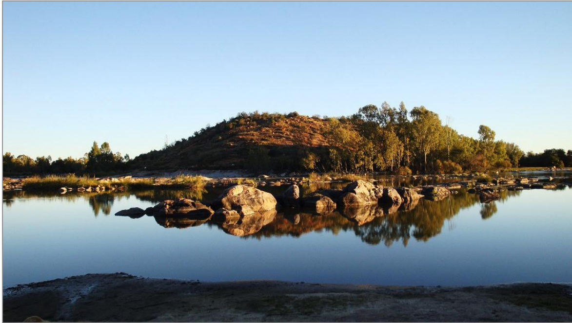
Figuur 82: Die terrein van die Slag van die Vaalrivier , Koppieskraal 357

rotsformasies . Ook die gevoel van spiritualiteit, 355 stilte en “afsluiting van die buitewêreld” is hier in die landskap (Figuur 82) alomteenwoordig. Vir die inwoners van SANWA, Koppieskraal, Reebok kop, Kromdraai en Waterval is God teenwoordig in die landskap. 356