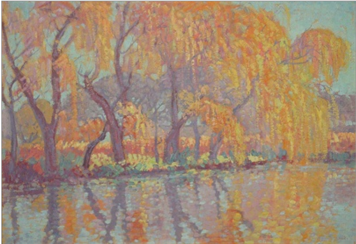
Figuur 84: J.H. Pierneef, Wilgers aan die Vaal (Tvl.) 364