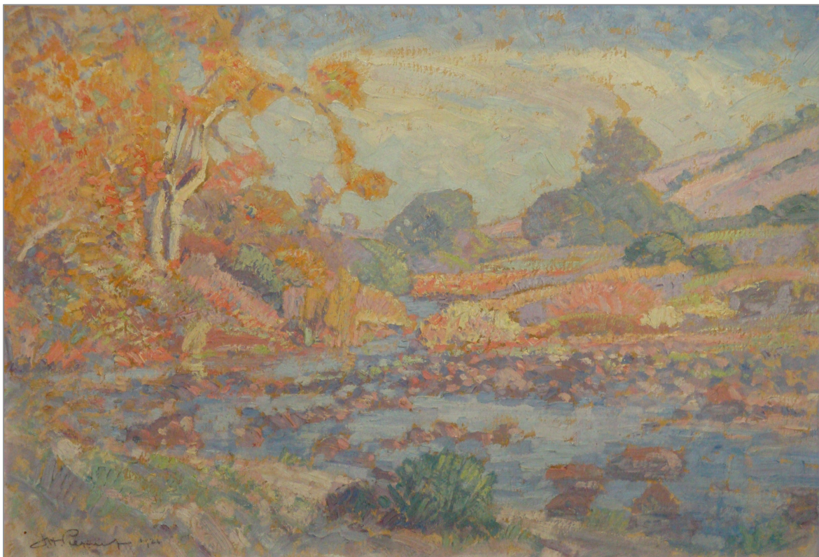
Figuur 85: J.H. Pierneef, Vaalrivier 365