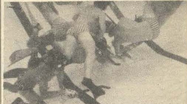
Onderwaterhokkie: 4 RAU-manne probeer verhoed dat Pukke nóg 'n doel aanteken. Die telling was egter nog 7-1 in die Puk se guns.