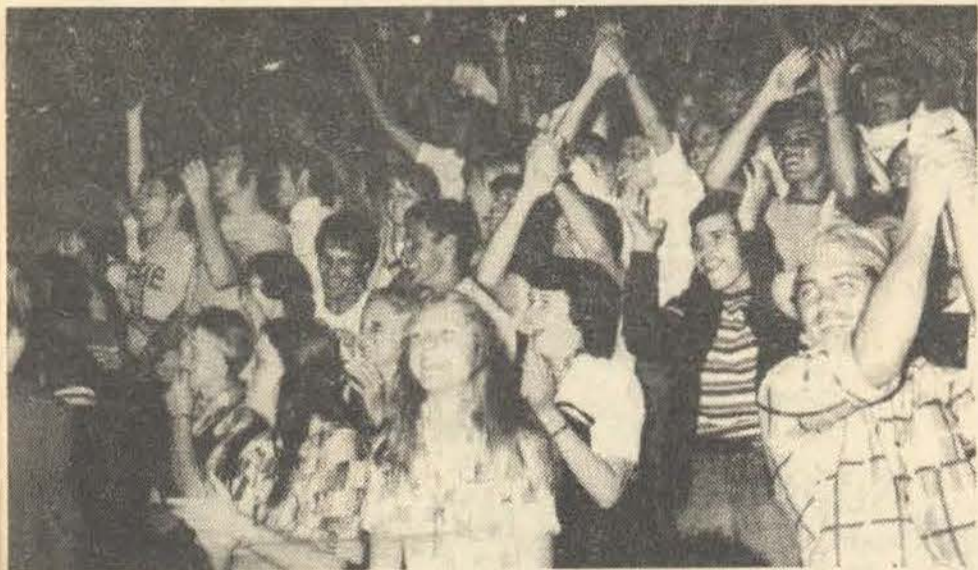
Die uitbundigheid van die Pukke op die pawiljoen tydens die wendrie is hier baie duidelik. (Foto: Fotokuns).

Van vroeg die oggend af het die Rautjies al aangekom en is die sportitems in helder sonskyn weer afgehandel. Die oggend se verrigtinge is baie goed bygewoon en is die bate van die Fanie du Toitsportterrein weer eens onderstreep.