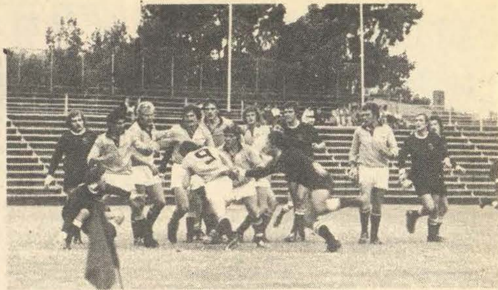
Die Pukke se skrumskakel het so pas 'n bal van die voorspelers ontvang, terwyl die voorhoede gereed maak om te ondersteun.