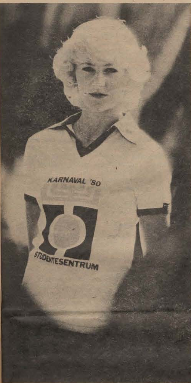
Die mooi Karneval '80-hempie, wat teen R4,00 by die inligtingskat beskikbaar is, word hier deur een van die kampusse pragtige dames vertoon.