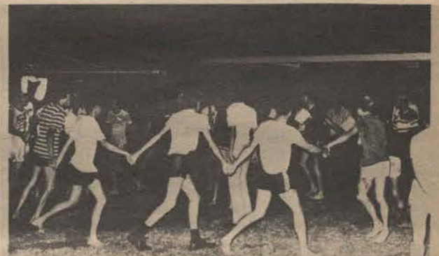
Afrikaner-eerstejaars moet plesierig wees, soos bewys is deur Klooster se eerstejaars tydens 'n aksie met Kulu.