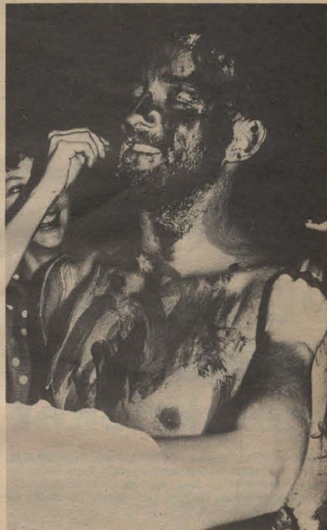
Vir finale afronding nog net 'n tikkie hier. Hierdie vriendelike kunstuk is Vrydagaand deur Kulu se ou-dames voltooi.