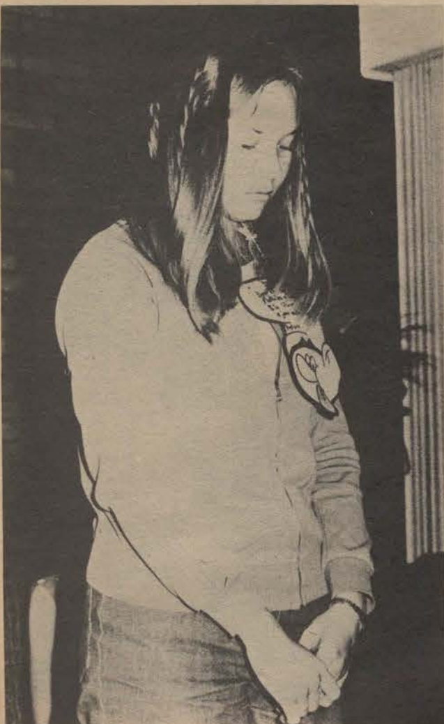
Oortuig daarvan dat die SSR sowel as die huiskomitees op rewolusionêre wyse omvergewerp is, weier hierdie eerstejaar om te reageer op bevel van haar nuwe leiers.