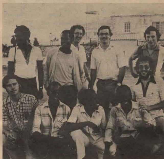
Die Uitvoerende Komitee van die Studente-Unie vir Christen Aksie.

Die Unie het drie basiese doelstellings: Ten eerste wil dit 'n forum vir kontak vir Christene van verskillende kampusse wees. Tweedens beoog hulle die bestudering en publiserings van Suid-Afrikaanse vraagstukke met die Woord van God as riglyn. Derdens beoog hulle om saam hulpprojekte van stapel te stuur om die behoeftiges in Suid-Afrika te bereik.