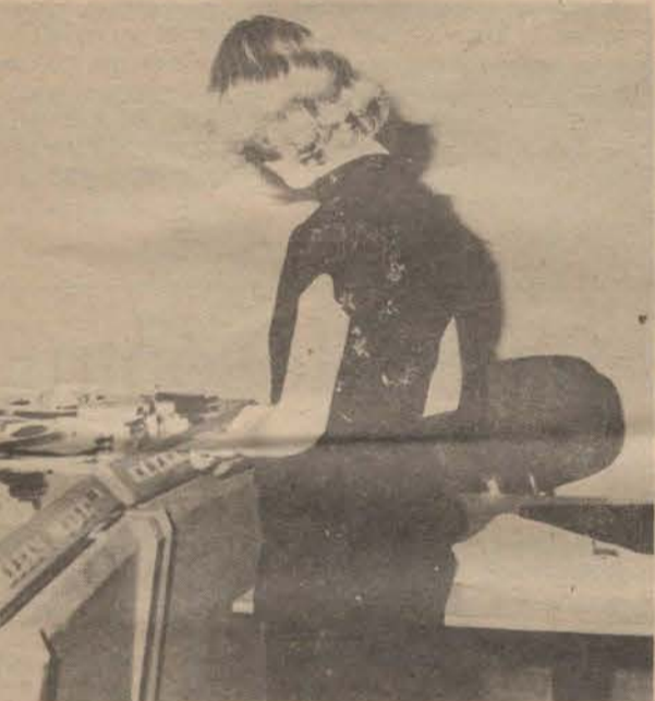
Radio-Puk het onlangs twee bandopnemers van die SAUK aangekoop.