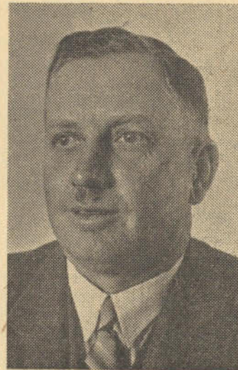
Ons in die Noorde sal ons deel doen.

Onmiddellike ondersteuning is nodig, teken in op die blad, en stuur enige fondse deur u ingesamel direk aan die Sekretaris, Die Republikein, Posbus 1411, Kaapstad. Alle bedrae sal erken word. Kragtige vrywillige bydraes is nodig. Die Suide het reeds die voortou geneem, en 'n aansienlike bedrag belowe.