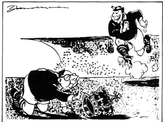
Dr T.E. Dönges (Minister van Finansies)

“...en nou maak hy gereed vir die vervyfskop...”