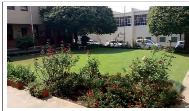
FIGUUR 6: 'En toe ek die oggend so uit my klas uitstap vir die eerste keer en die rooi rose was daar so voor my tuin, en hulle het so geblom en daai grasperke ... dit was vir my die ongelooflikste oomblik by Oranje.'