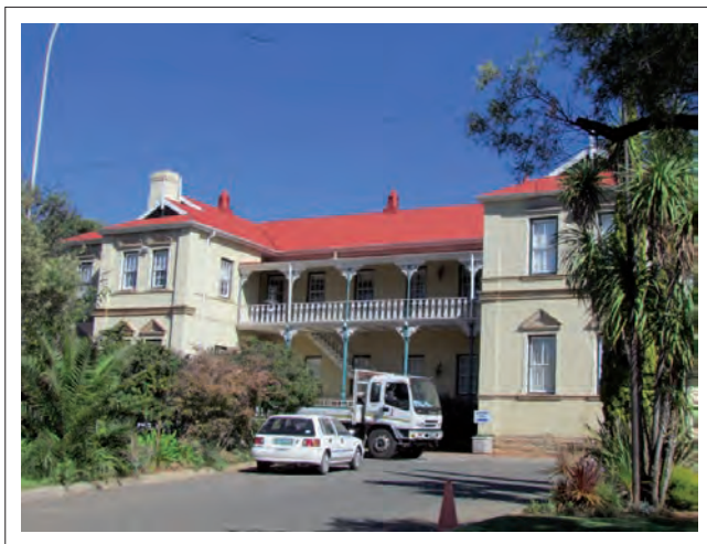
FIGUUR 4: Le Roux-huis, wat as koshuis en personeelkamer vir die primêre skool dien.

Leerder A verwys ook na die Voortrekkernooientjie (sien Figuur 5) voor die gebou: