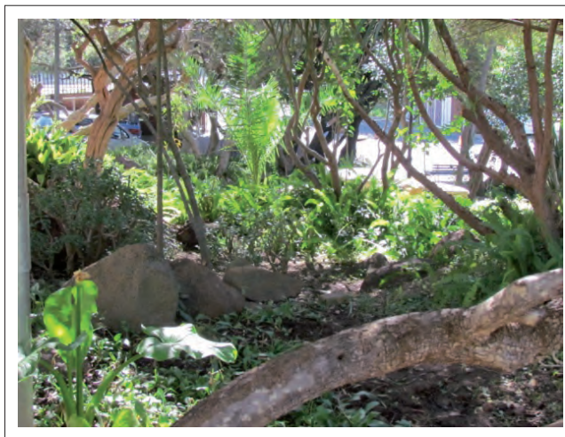
FIGUUR 12: 'Daar was 'n klip wat 'n rekenaar was.'

Uline (2000), aangehaal uit Uline en Tschannen-Moran (2008:68), reken dat ' if carefully conceived, the separate spaces of a school reinforce each other physically and aesthetically, creating rich environments where interpersonal relationships can flourish '. Uline en Tschannen-Moran (2008:68) se argumente sluit ten nouste aan by leerder A se beskrywing hierbo van hul speltjie en hoe die tuine hulle tuis laat voel het: