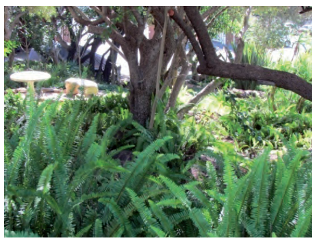
FIGUUR 8: Tuine waar die kinders kan sit.