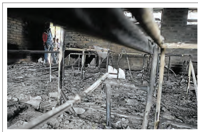
FIGUUR 1: Frank Mukhaswakule Primary was een van die dertien skole wat deur betogers in Vuwani, Limpopo aan die brand gestee is.