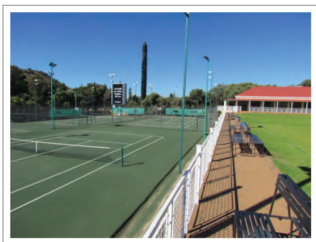
FIGUUR 2: Oranje se tennisbane en klubhuis.

Die redes waarom ons spesifiek hierdie skool gekies het, behoort duidelik te blyk uit die profiel van die skool hierbo. Dis