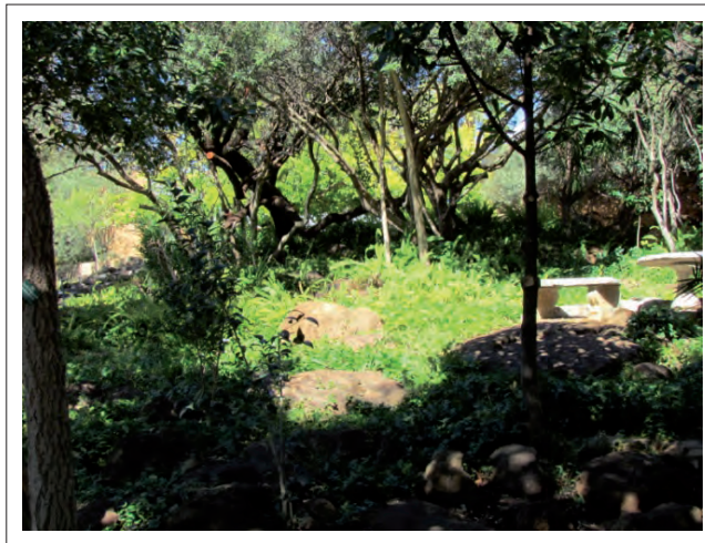
FIGUUR 11: 'Elke klip was iemand se bed.'

En jou ma het jou nou maar baie sport en goed laat doen. Maar dan tog in die later middag het jy nou oop tyd gehad en dan het ons so in die tuine gespeel. Ons het huis-huis gespeel. Elke klip was iemand se bed [sien figuur 11]. Daar was 'n klip wat 'n rekenaar was [sien figuur 12]. Ons het daar sommer van die middagstudiekinders wat daarbo bietjie papiere gemors het, ons het die papiere verwerk in ons kombuis en later weggegooi. Nee, die tuine – hoe ons in hulle gespeel het en hoe jy eintlik ook so tuis gevoel het. (p. 68)