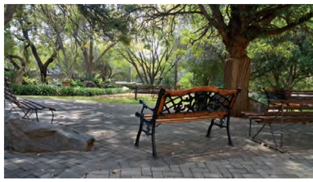
FIGUUR 7: Vriendelike tuine waar die kinders kan sit.

Daar is in die vorige afdeling verwys na die tradisie dat die matrieks van Oranje op hulle laaste skooldag 'n seremonie by die Voortrekkernooientjie hou om sodoende afskeid te neem van die skool. Ouers woon dikwels hierdie seremonie by. Die skool hou ook jaarliks 'n kransleggingseremonie by die Vrouemonument in Bloemfontein, waarheen oudskoolhoofde en -leerders genooi word (sien Figuur 9). Dit is maar twee