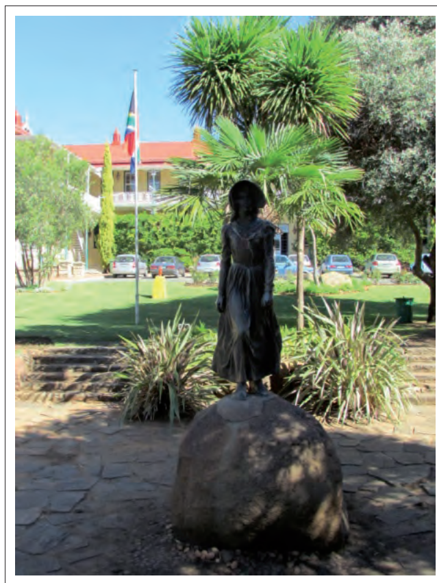
FIGUUR 5: Die Voortrekkernooientjie met Le Roux-huis in die agtergrond.