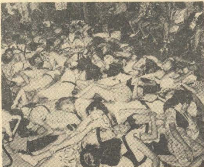
Hoe lank sal seniors nog hierdie voorreg geniet?