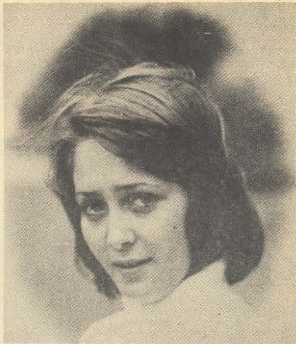
Hierdie blom het oor die kampus geloop toe ons fotograaf haar gesien het. Hy kon net nie anders as om sy kamera te kiek nie. Ek het onwillekeurig aan die volgende gedink: „We all have dreams. Some come true, while others become plays — never to be performed”.