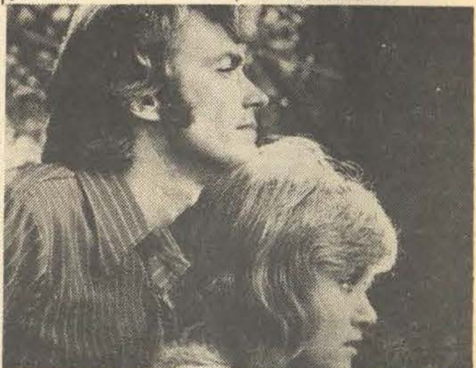
Clint Eastwood en Donna Mills soos hulle verskyn in Cinepuk se rolprent Play Misty for Me.

U het volop keuse in ons groot verskeidenheid