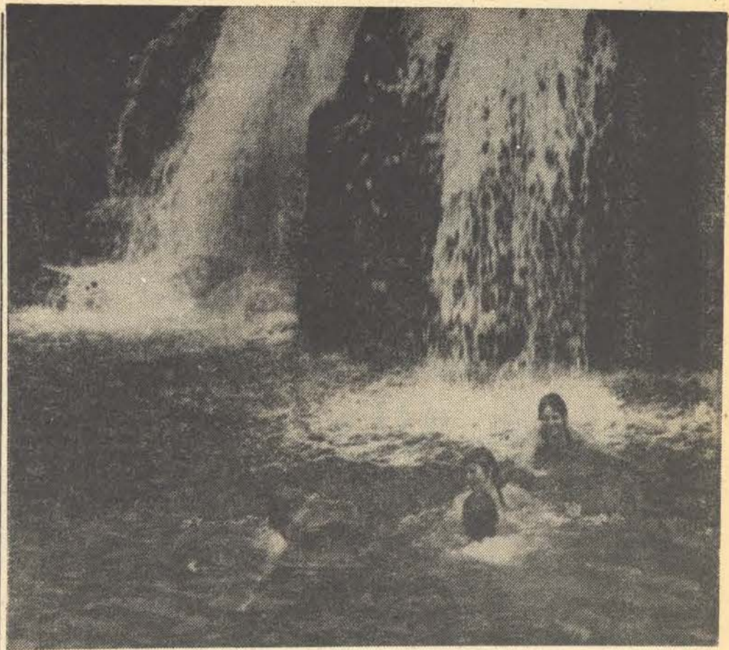
Florna toer die vakansie weer Drakensberge toe. Hier swem 'n paar van die toerlede wat 'n klinkklare bewys is dat dit nie net bloed, sweet en klim gaan wees nie.

BESEMBOS '74 en Sakboekies '75 by die S.R.-kantoor teen R1,00 elk beskikbaar. Ook baie aandenkings.