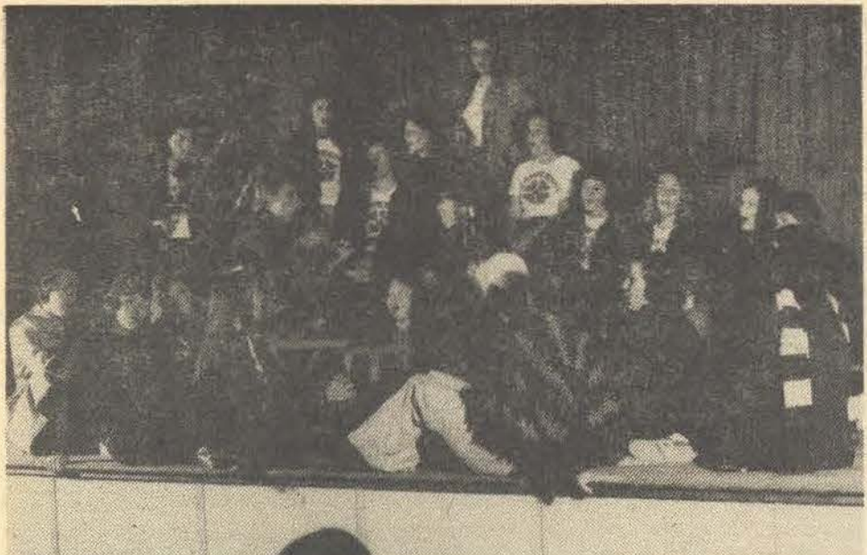
Klawerhof, wenners van die dames se sêrkompetisie, hier op pad na hul oorwinning. Die beoordelaars het 'n harde tyd gehad om die wenners aan te wys.