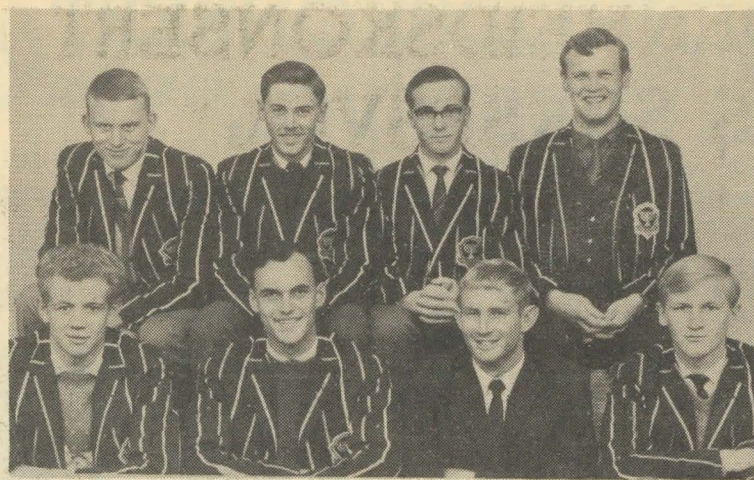
Die P.U.-stoeispan is: