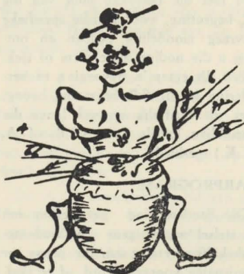
Postmahuis, P.U. vir C.H.O.