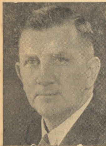
Dr. Hans van Rensburg

Die K.G., dr. Hans van Rensburg, skryf as volg na aanleiding van VRYHEIDSDAG 1948: