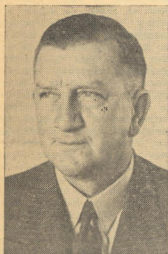
Die K.G. (24 Sept.)