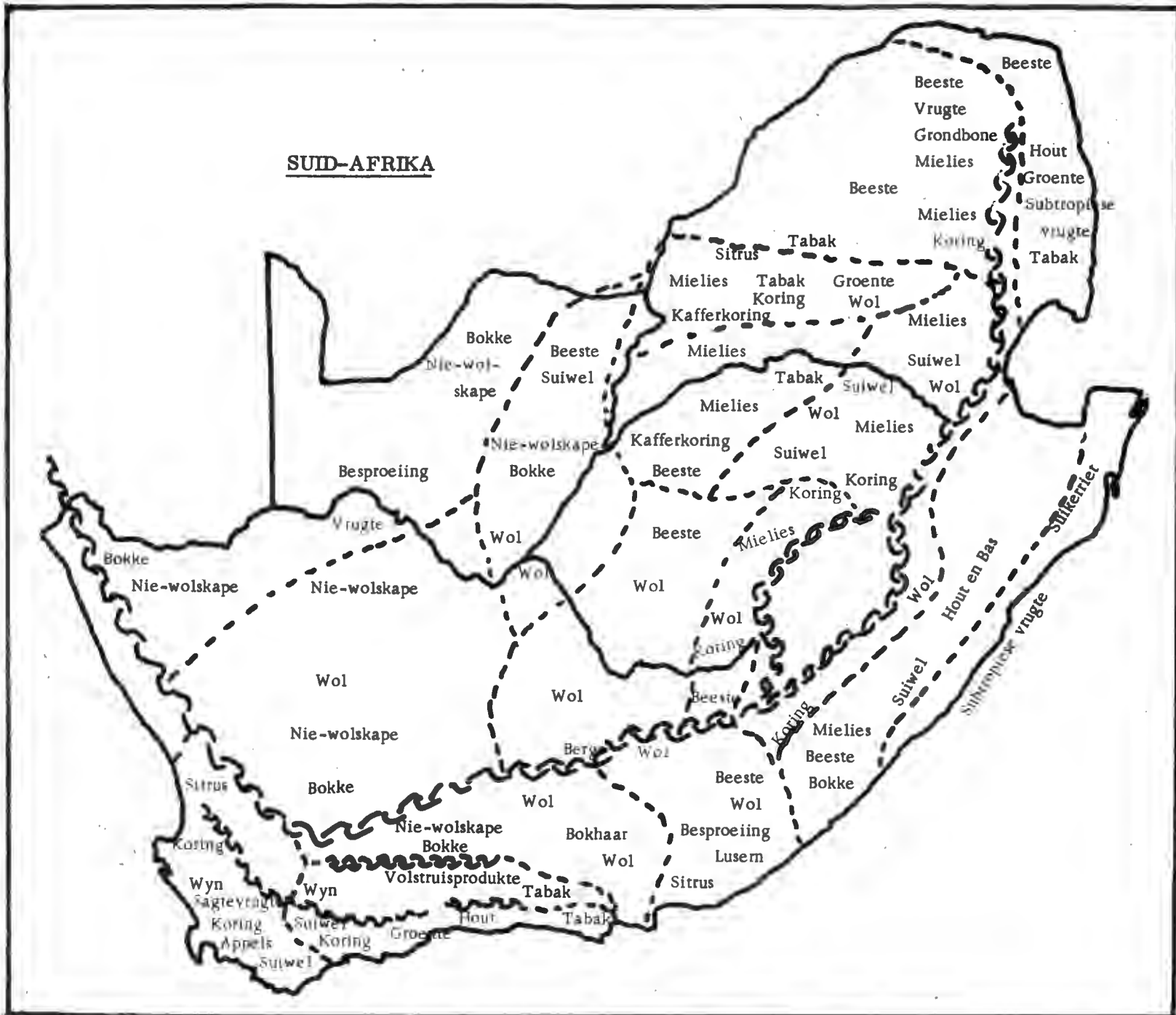
KAART VAN SUID-AFRIKA