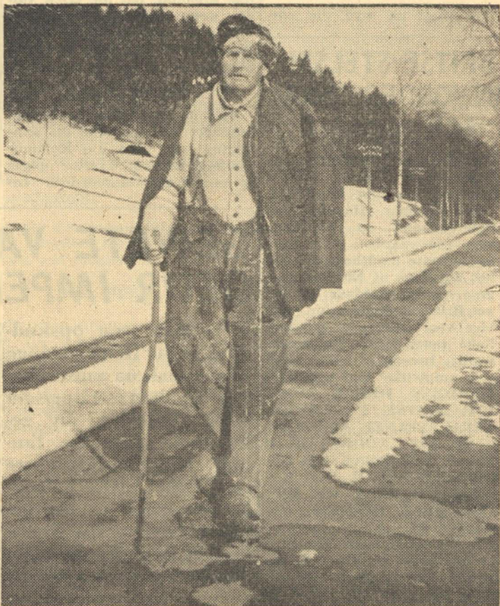
'n Duitse krygsgevangene van Rusland in gelapte klere teen 'n sneeubedekte agtergrond.