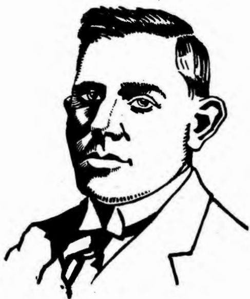
C. Louis Leipoldt