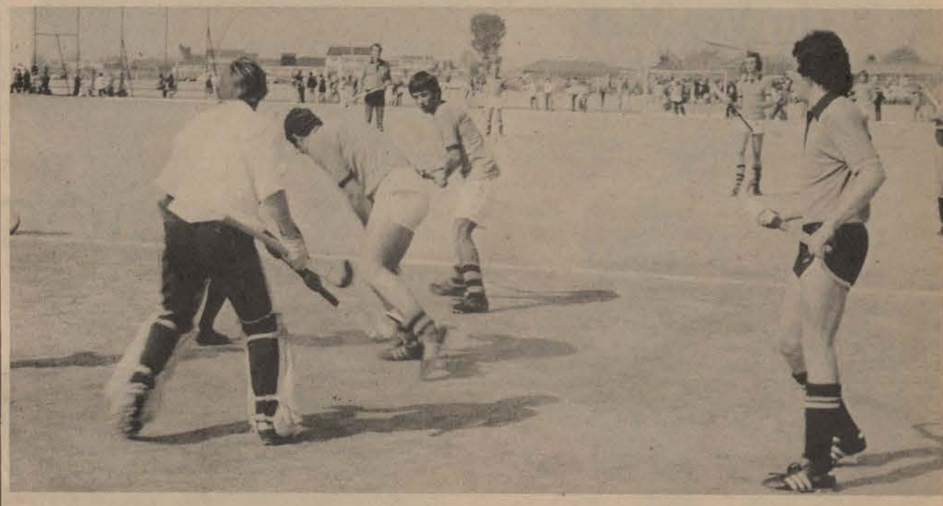
Manshokkie gaan hierdie jaar weer groot hoogtes bereik.

Die sukses hiervan sal afhang van die getroue en entoesiastiese deelname van elke sportman in sy betrokke sport. Hierdeur sal minder potensiele sportsterre verlore gaan en kan dit as belangrike bron van Puk-sportspanne dien.