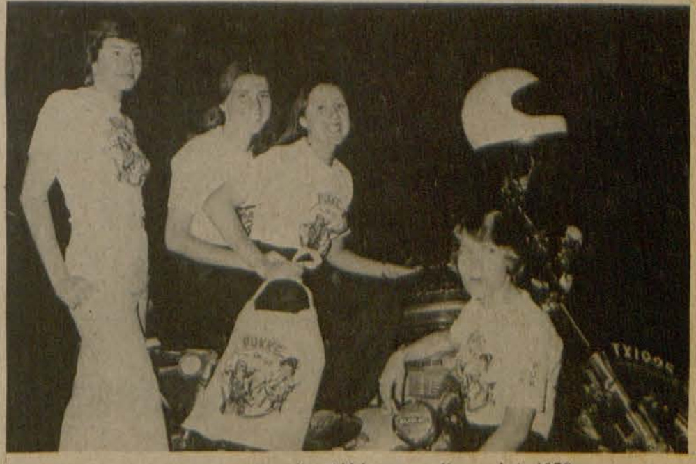
Motorfietse is een van die middelpunte van Karnaval vir 1978.

met 'n fenomenale eindopging vorendag gekom en gewen. Die seniors se lyste is nog nie ingehandig nie en dit kan lei tot 'n heel nuwe wending in die huidige puntestand. Die lyste moet dus ook maar so gou as moontlik inkom sodat die finale puntestand bepaal kan word.