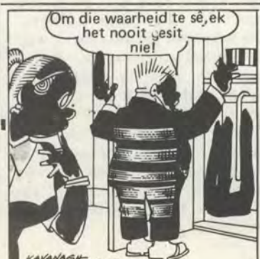
„Om die waarheid te sê, ek het nooit gesit nie!”

Verder sal gepoog word om nouer skakeling tussen dorpstudente en koshuis-studente as in die verlede te bewerkstellig. So 'n nouer skakeling sal noodwendig moet volg op groter deelname aan sport en sosiale aktiwiteite. Dit sal ook 'n groot leemte vul wat oor jare ontstaan het.