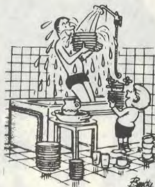
„Is dit nie slim nie, Pa? 'n Vreugou noudt daaraan gedink het om dit so te doen nie.”