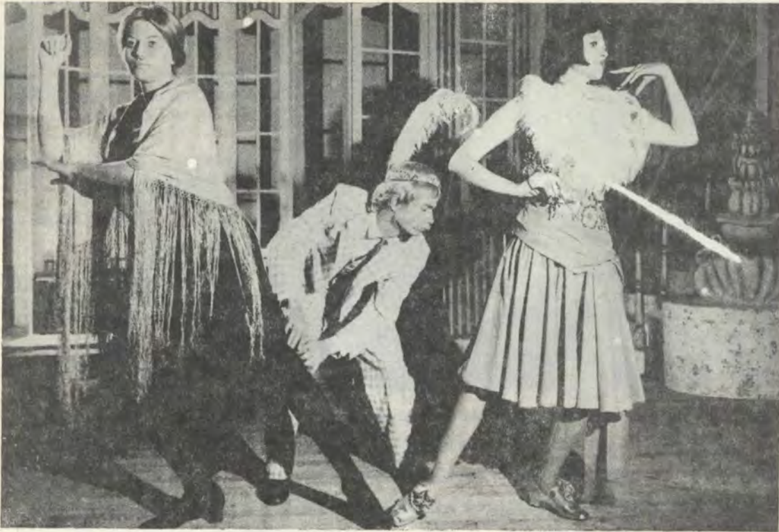
„Die Drie van der Walts” word eersdaags in die Totiussaal opgevoer. Die Departement Spraakleer en Drama bied hierdie toneelstuk aan.