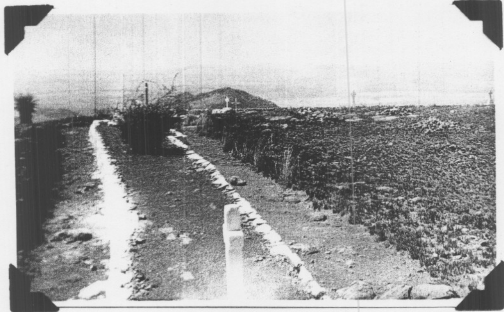
Dieselfde massagraf as die vorige maar van die trappies van die gedenksteen af afgeneem. Die Alwynkoppie verskyn op die agtergrond.