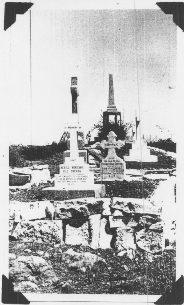
Massagraf van die oostekant af afgeneem met die gedenksteen van die vorige bladsy op die agtergrond.