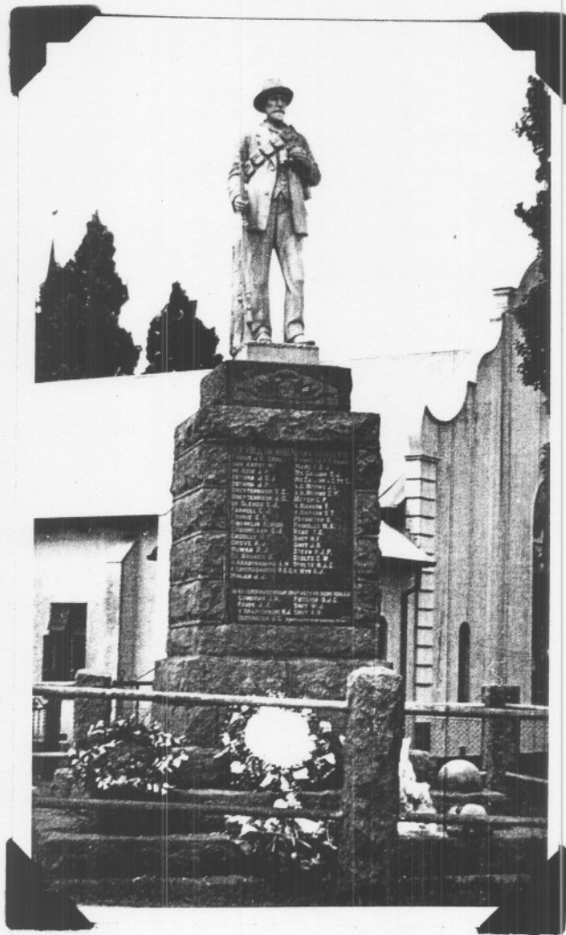
Burgermonument op Carolinda.