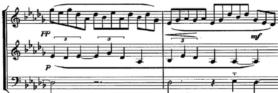
Figuur 1: Grové, Mbira-lied op die nagbriesie gedra , mate 5-6

Contrary to the beliefs of many musicologists, my Afrocentric style did not form a complete break from my previous style. It is a continuation of my energy-driven music, but with the addition of 'African' rhythmic groupings, descending tendencies in my phrase construction and, of course, the ostinato element.