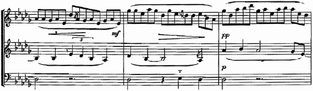
Figuur 3: Mbira-lied op die nagbriesie gedra, maat 13–15. Die omvang van drie oktawe in maat 15 (D-mol tot D-mol 6 word nie oorskry nie).

Dit wil gevolglik voorkom asof daar selfs op 'n onderbewuste vlak 'n instelling is om spesifieke karaktereenskappe van die Afrika-instrument te herken. Die fyn waarnemingsvermoë van kunstenaars is hier ter sprake en aangesien die komponis nie bewus was van die feitlike gegewe van die omvang nie, is Grové se geoefende oor (soos in die narratief hierbo) die sintuiglike deelhebber om die vertaling tussen musikale kulture (kyk Erlmann 2004:14) te bewerkstellig.