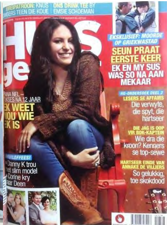
(10 Mei 2012)