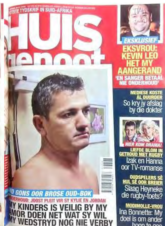
(13 Sep. 2012)