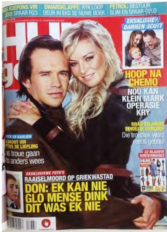
(26 Apr. 2012)