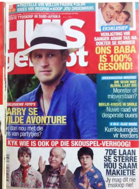
(6 Sep. 2012)