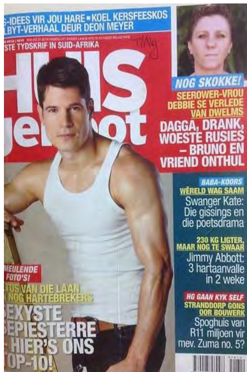
(20 Des. 2012)

In die volgende drie hoofstukke sal die laaste navorsingsvraag en -doelstelling van die studie aan die orde kom wanneer die drie mees prominente onderwerpe bespreek word.