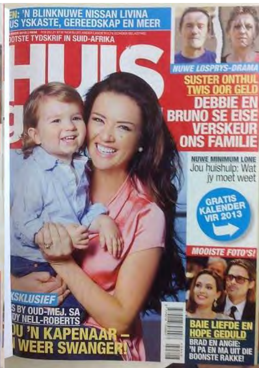
(6 Des. 2012)