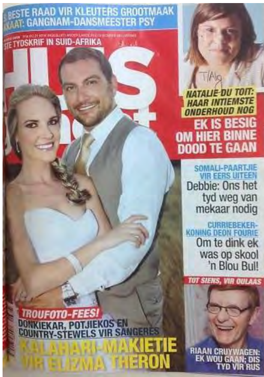
(15 Nov. 2012)