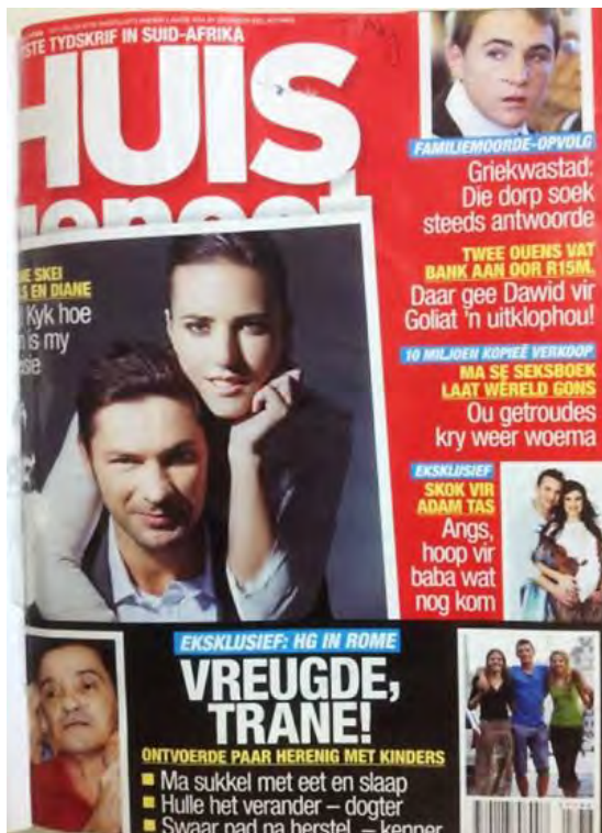
(5 Jul. 2012)