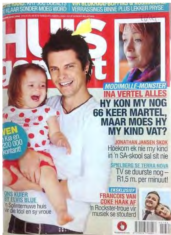
(2 Feb. 2012)