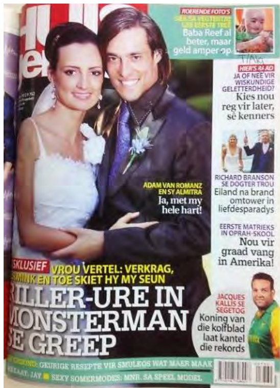
(19 Jan. 2012)