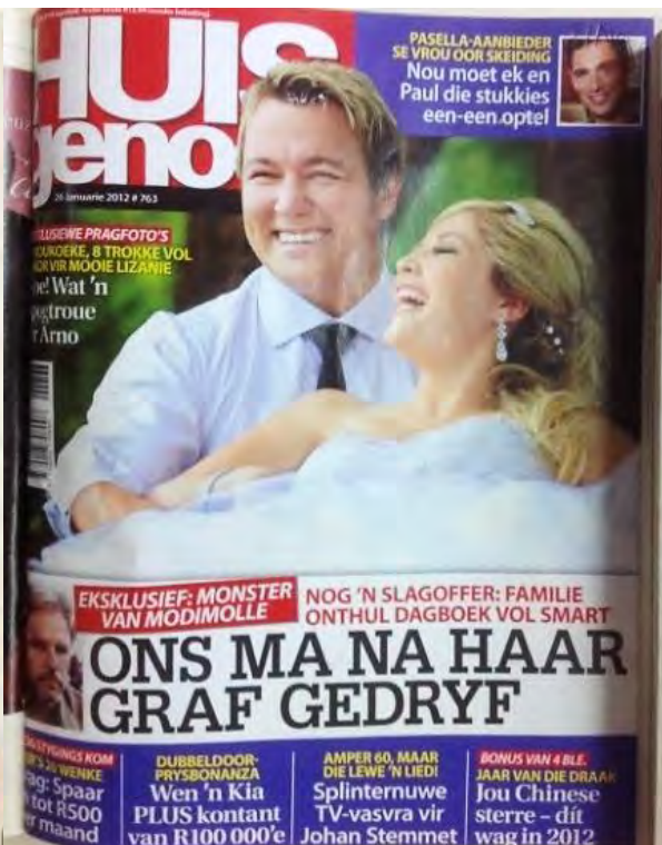
(26 Jan. 2012)