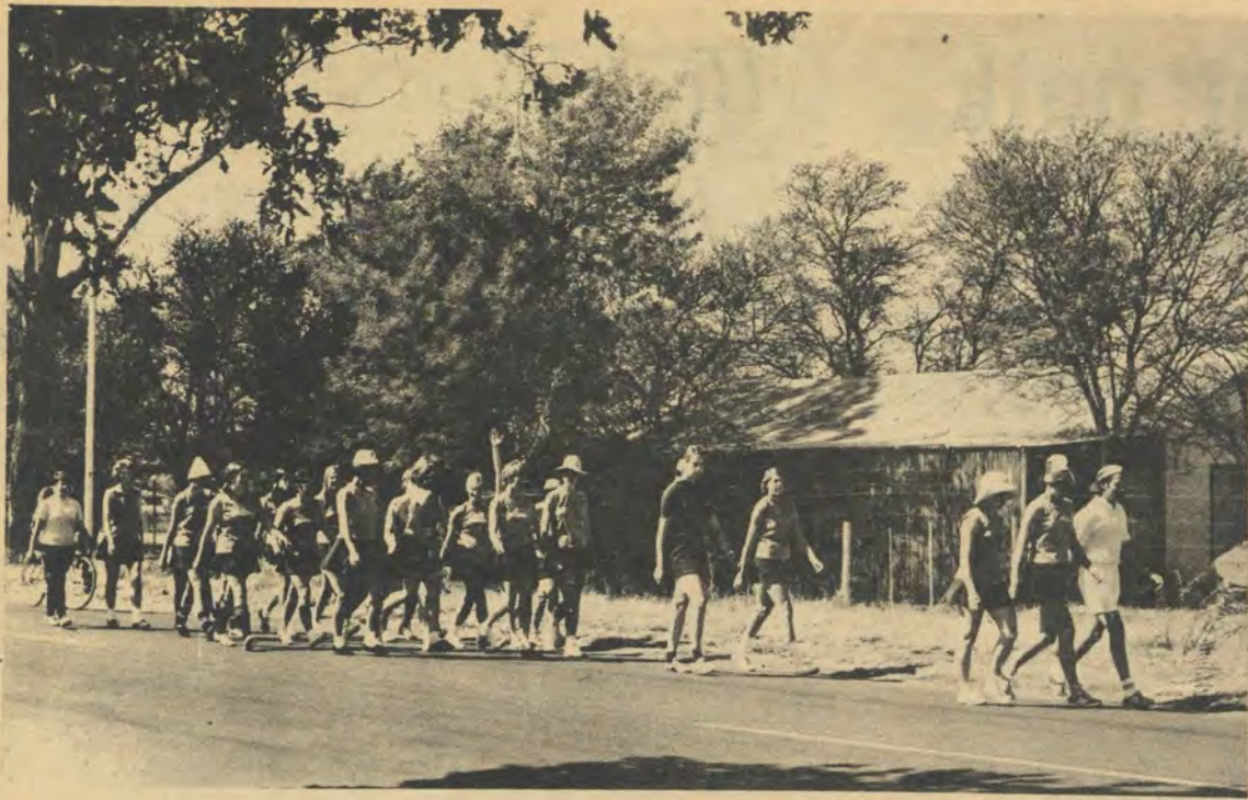
Die dames van die departement Liggaamlike Opvoeding neem deel aan die Lenteloop. Dié poging het nie saamgeval met die massaloop nie.