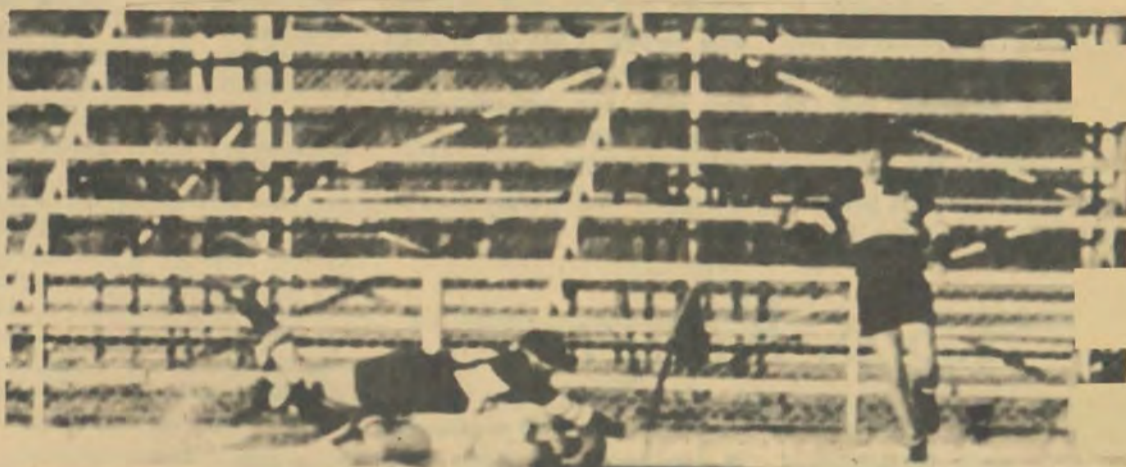
Dis Tiaan Coetsee wat hier 'n sagte landingsplek verskaf vir 'n lastige Poot. Net jammer die Poot was te laat. Die Puk het met die grootste oorwinning in baie jare, nl. 30-3 geseëvier oor 'n Potevyftiental wat met die stert tussen die bene van die veld afgesluip het.