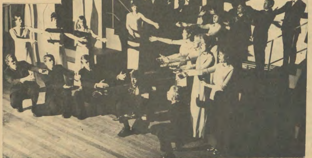
Die Alabama-toergroep wat weer terug is na 'n besonder suksesvolle toer met Revue '70.