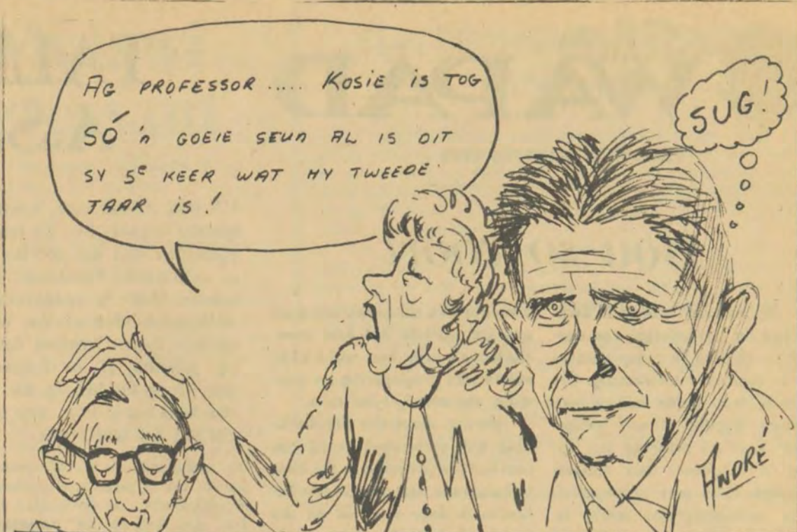
OUERS VAN DIE TWEDEJAARS BESOEK UNIVERSITEIT MÖREOGGEND.