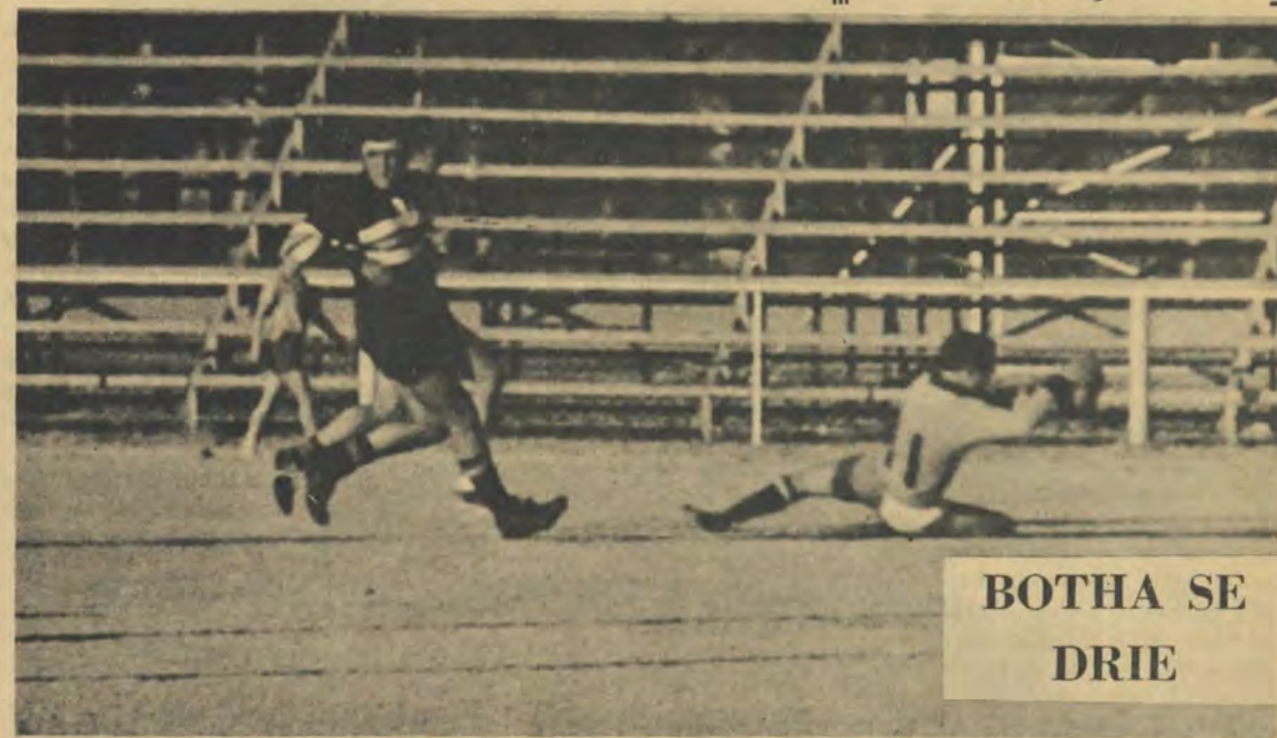
BOTHA SE DRIE

Na die Theos se groot oorwinning oor Pote is hulle mos aangewese om die All Blacks môre op te dons!