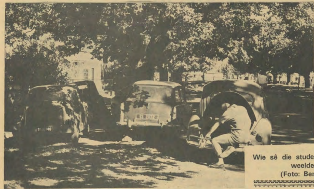
Wie sê die studente lewe nie in weelde nie?