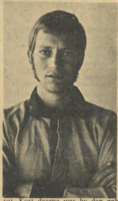
vat. Kort daarna was hy dan ook in die eerste span.

Vanjaar tydens die Pukproewe, is hy ernstig beseer en het hy eers laat vanjaar begin speel. Aanvanklik wou dinge nie vlot nie, maar in die tweede span se wedstryd teen Sasolburg, het hy skielik vlamge-