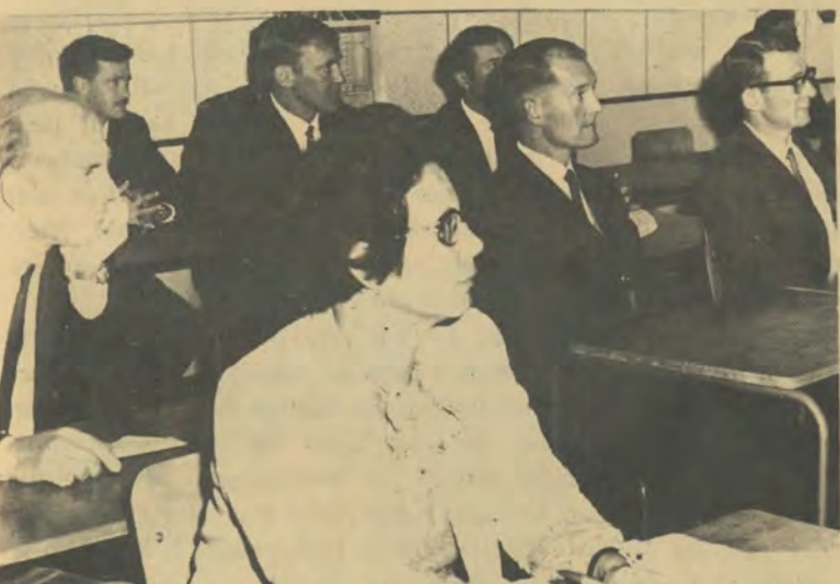
Dosente luister aandagtig na 'n lesing. Soos gesien kan word het hulle nie nodig om aantekeninge af te neem nie, want hulle kry afgerolde aantekeninge.