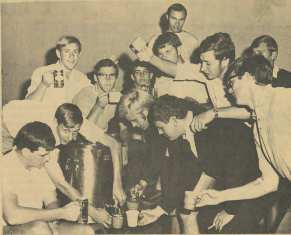
So lyk dit as Uitspan se manne in die aand teekan toe staan.